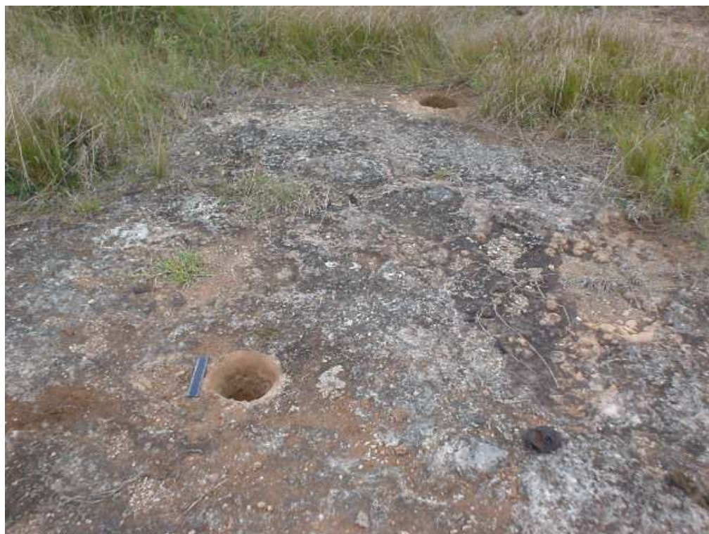
Figura 3. Área donde se pueden observar las huellas de poste socavadas en la roca estructural.

El 23 de noviembre del año 2003, en expedición conjunta de los grupos espeleológicos Luis Montané y Cacique Yaguacayex del Comité Espeleológico de Matanzas, SEC, los autores detectan en un área aproximada de 16 m 2 la presencia de tres hoyos socavados en la roca estructural, mientras se efectuaban trabajos de exploración minuciosa de la superficie del asentamiento (Hernández y Rodríguez 2005a).