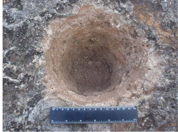
Figura 6. Huella de poste No. 3.