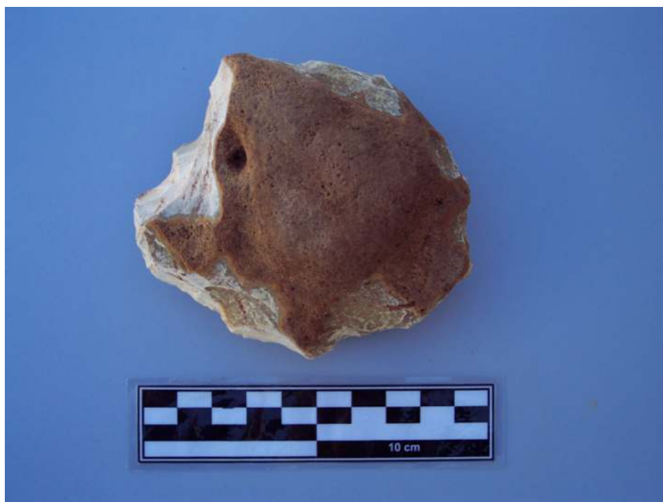
Figura 8. Lasca primaria de pedernal (sílex).

Con posterioridad, se procedió a extender la excavación hacia la probable ubicación de las huellas de poste, basándonos en la regularidad de las mismas, localizándose otro posible hoyo que no parece corresponderse al contexto estudiado.