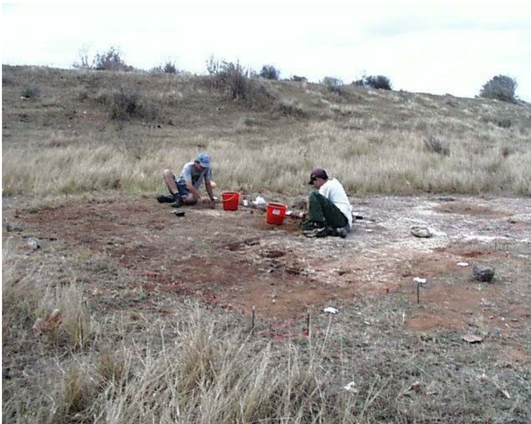
Figura 7. Vista de los trabajos de excavación.