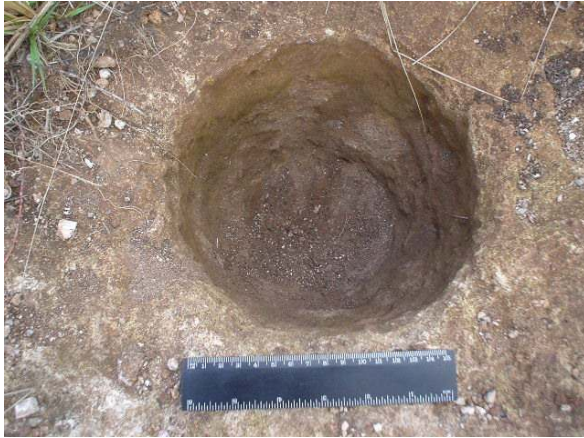
Figura 5. Huella de poste No. 2.