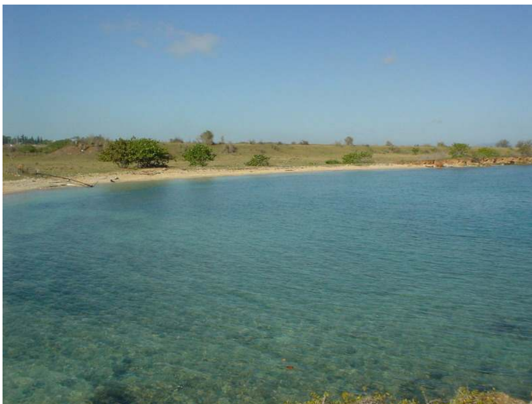
Figura 2. Vista del asentamiento El Morrillo, Matanzas, Cuba

de excavación para la franja contigua a la línea de costa, área menos alterada del asentamiento, sustentado por la destrucción del sitio por elementos naturales, calculando una pérdida aproximada de 3 metros de fondo en un frente de más de 100m, en un periodo de tres años.