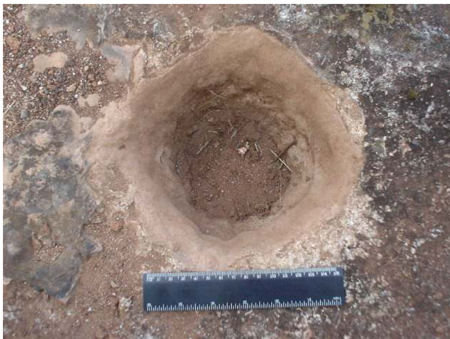
Figura 4. Huella de poste No. 1.

El mencionado descubrimiento está compuesto por tres hoyos que forman un arco con una distancia de 2,76m y 2,26m respecto al del centro (fig. 3). El primero posee un diámetro de 19cm y una profundidad de 16cm (fig. 4). El segundo tiene 21cm de diámetro y 15,8 de profundidad (fig. 5). Por su parte el tercer y último hoyo encontrado hasta ese momento, posee un diámetro de 19,5cm y una profundidad de 15,7cm (fig. 6).