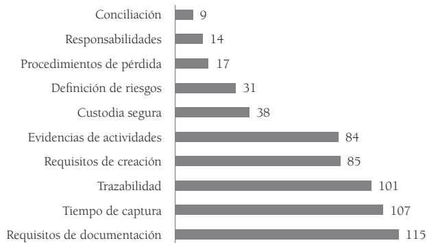
Figura 2. Incidencia de los problemas de gestión documental en los hechos de corrupción