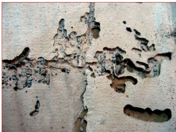
Figura 13. Daño producido por termites en un libro de las salas de depósito del Museo de La Plata

En las salas de depósito de la biblioteca del museo, se halló un antiguo ejemplar con una afectación severa de termites. En este volumen, se observan galerías regulares sin residuos, así como galerías irregulares (figura 13). Probablemente, esta plaga proviene del sitio anterior donde se hallaba depositado el ejemplar, ya que no se observó evidencia de termites en otros ejemplares cercanos ni en el edificio del museo en sí (ventanas, estanterías). Por el contrario, en el Archivo Nacional de Cuba, sí se detectaron heces de termitas de madera húmeda en algunos ventanales de madera, pero no en los documentos revisados.