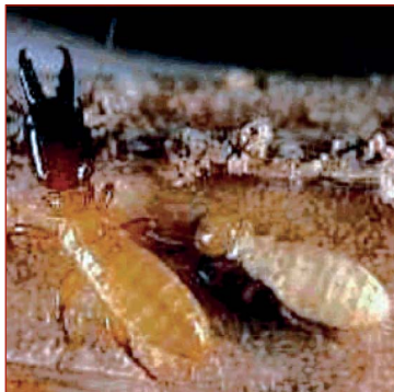
Figura 12. Soldado mandibulado y obrera