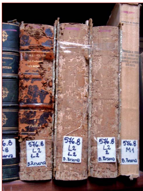
Figura 2. Galerías realizadas por anóbidos en las salas de depósito de la Biblioteca del Museo de La Plata

En la biblioteca del museo, se localizaron numerosos volúmenes que poseen sus cubiertas de cuero con diferente grado de deterioro (figuras 2 y 3), así como numerosos orificios realizados por los adultos al emerger (figuras 4 y 5) y polvillo fino en la cara interna de las tapas que corresponde a excrementos y material eliminado a medida que avanzan las larvas cavando las galerías. Asimismo, se detectó la presencia de una larva viva en una de dichas galerías. Al analizar con microscopio estereoscópico varios volúmenes, se identificaron diferentes partes del cuerpo correspondientes a insectos (figura 6); estos fueron identificados como Stegobium paniceum (Linneo) “carcoma del pan” (figura7), Anóbido.