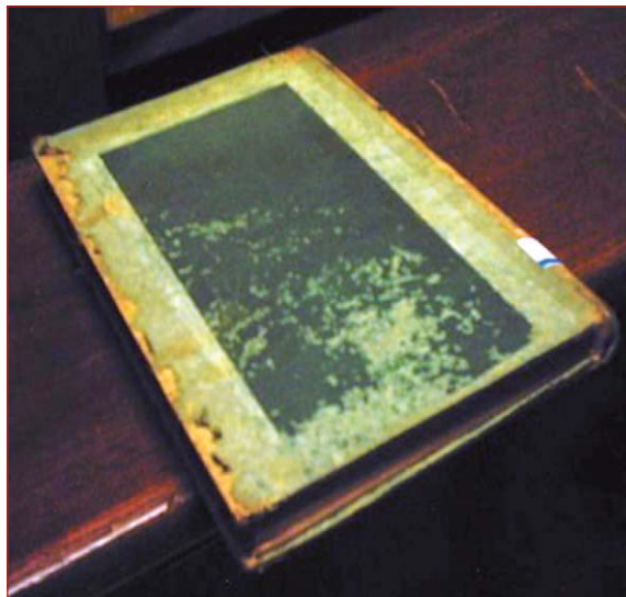
Figura 17. Detalle del daño producido por pescaditos de plata en el Archivo Nacional de Cuba