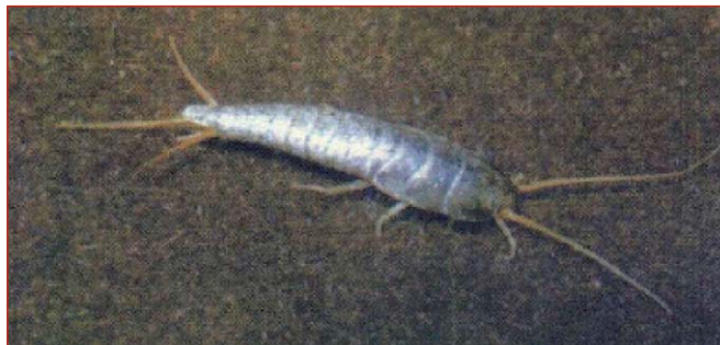
Figura 16. Adulto de pescadito de plata

Los pececillos de plata (orden Zygentoma) se caracterizan por poseer el cuerpo aplanado, recubierto por escamas plateadas, aguzado en el extremo terminado en tres largos filamentos (figura 16). Requieren de alta temperatura y humedad para su desarrollo. Estas condiciones las encontrarán en bibliotecas, archivos y depósitos, por lo cual se convierten en sus más frecuentes habitantes. Valiéndose de su cuerpo fusiforme, se abrirán fácilmente camino entre las hojas de los libros, raspando y desgastando la superficie del papel, suprimiendo parcial o totalmente lo impreso y, sólo en ocasiones, dejarán agujeros irregulares en la superficie (figuras 17 y 18). Se alimentan del pegamento utilizado para encuadernar libros o del moho que invade estos recintos. Asimismo, pueden provocar afectaciones a soportes especiales como son fotografías, mapas y planos.