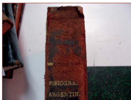
Figura 15. Daño producido por cucarachas en volúmenes de las salas de depósito de la biblioteca del Museo de La Plata