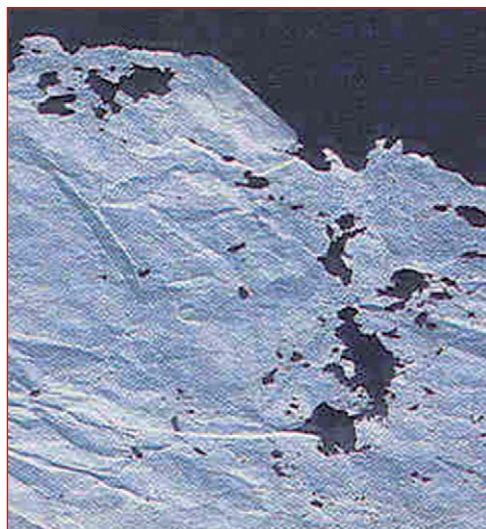
Figura 18. Detalle del daño producido por pescaditos de plata en el Archivo Nacional de Cuba