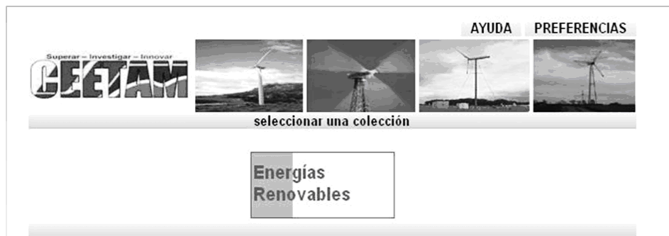
Figura 3. Interfaz de la Biblioteca Digital del CEETAM.