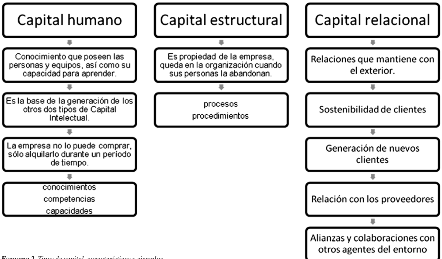
Esquema 2. Tipos de capital, características y ejemplos.