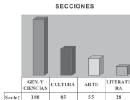
Gráfico 1. Cantidad de trabajos por secciones del índice de Revolución y Cultura.

Dentro de la sección de Generalidades y Ciencias Sociales fueron mayoría los trabajos que abordaron la guerra en Viet Nam (1960-1975), la historia de América Latina, las luchas de los movimientos de liberación nacional y