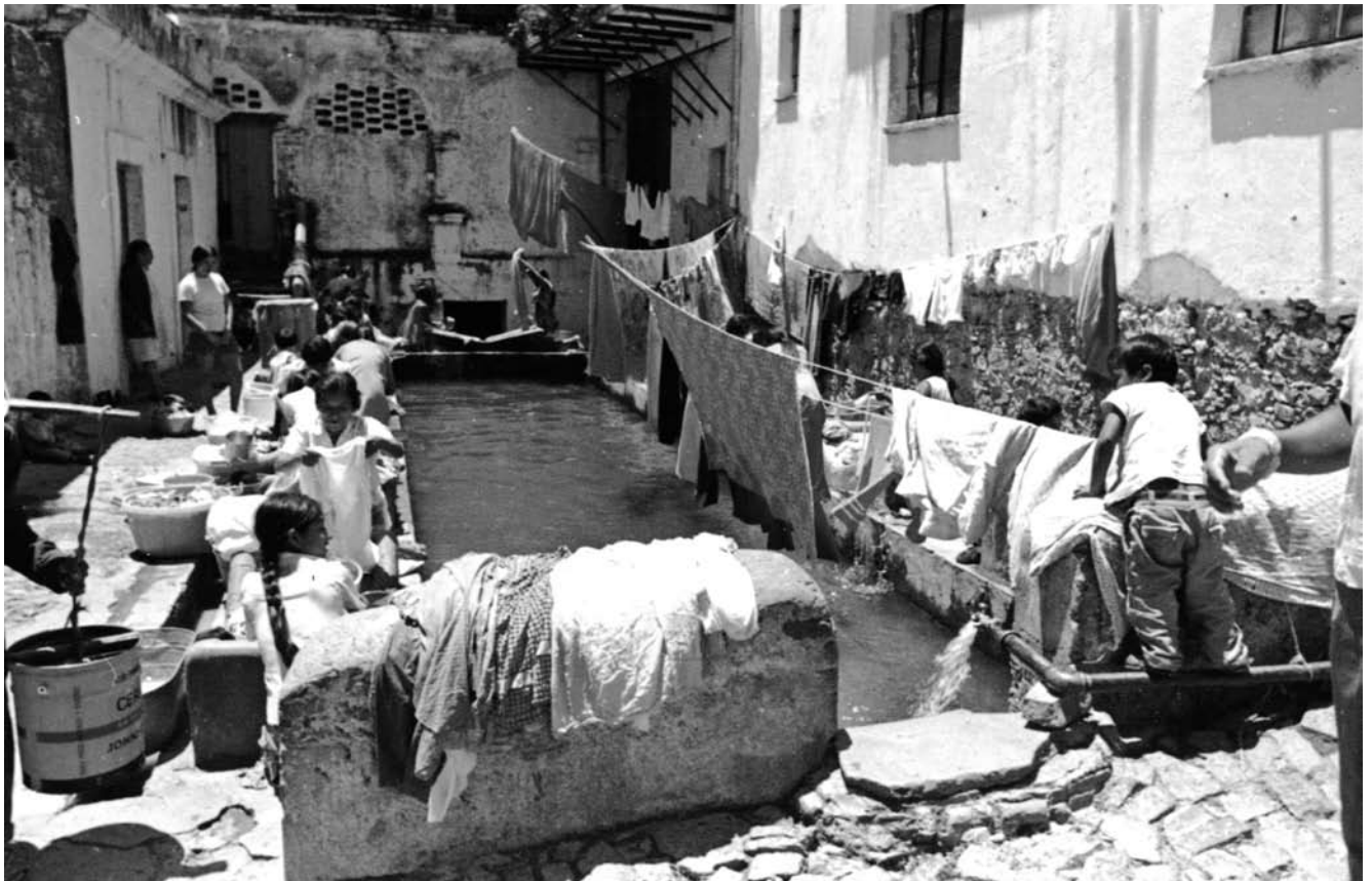
Pileta y lavaderos , 1974, Taxco, Guerrero.