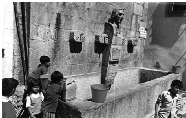
Fuente colonial en Taxco, 1974, Taxco, Guerrero.