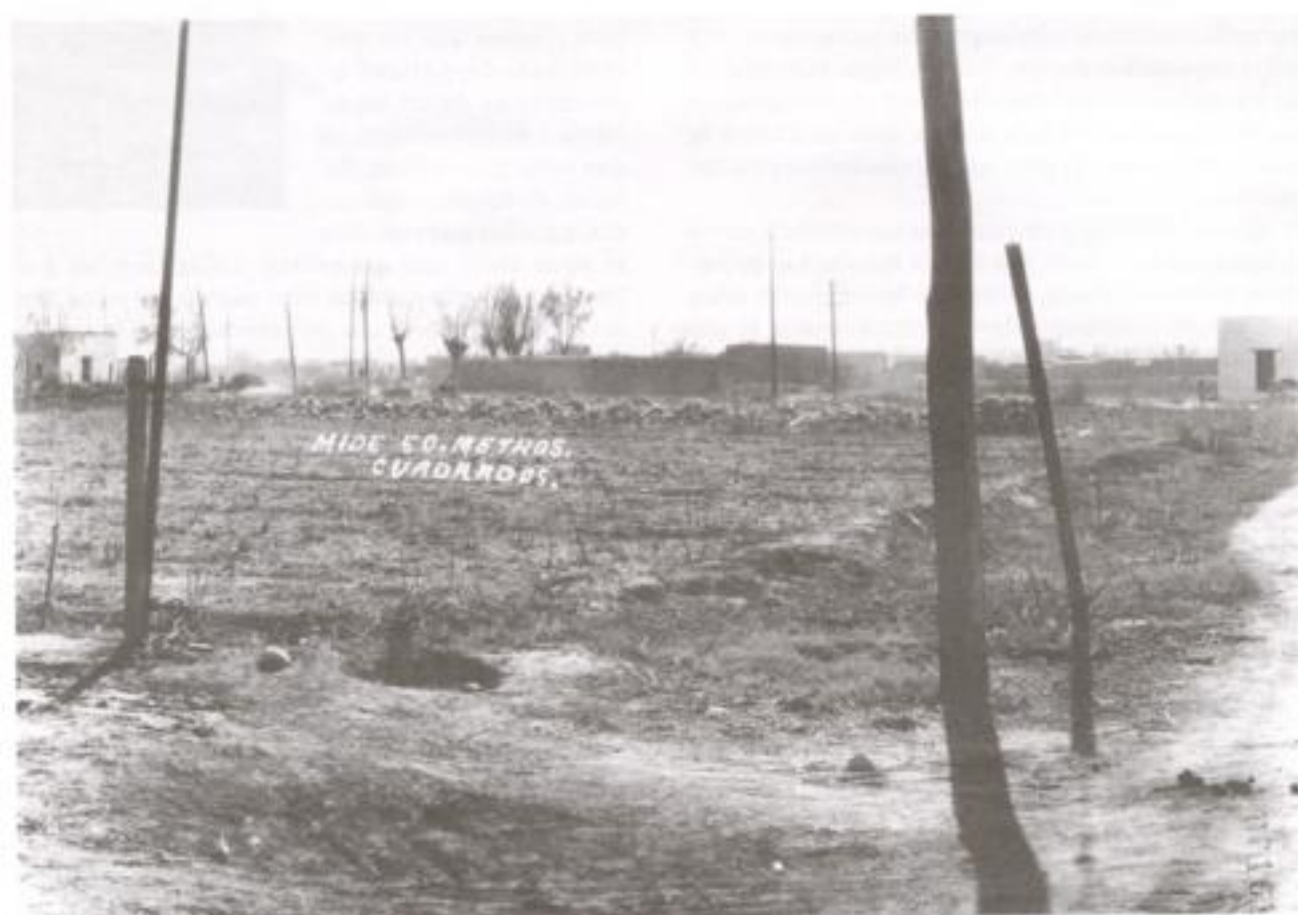
Terrenos que ya no se cultivan, 1928, Cd. Juárez, Chih., AHA, Aprovechamientos superficiales, c. 328, exp. 7183.