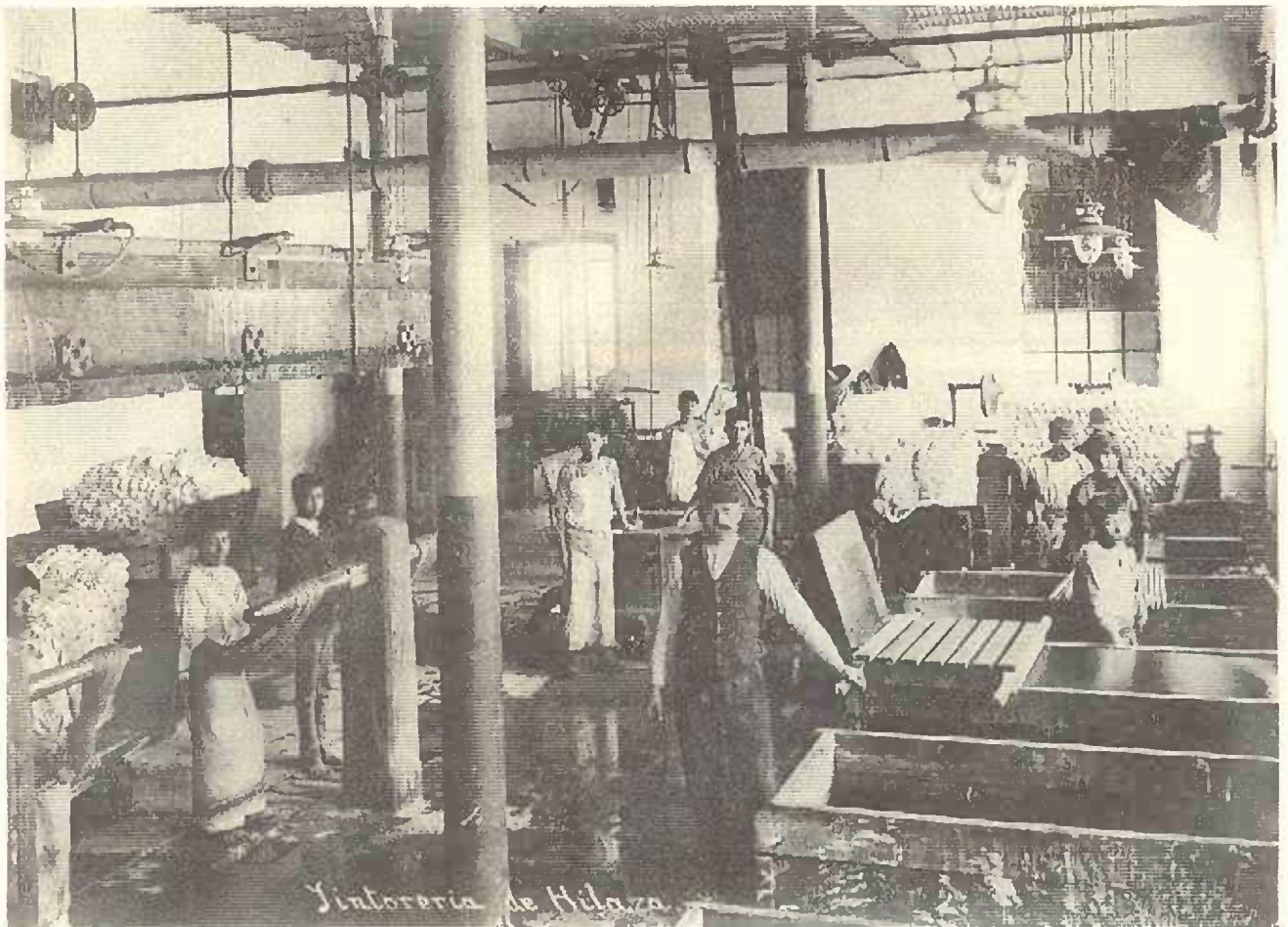
"Tintorería de Hilaza", 1917, Compañía Industrial de Atlixco, Puebla. Archivo Histórico del Agua. Aprovechamientos Superficiales, caja 4209, expediente 56695.