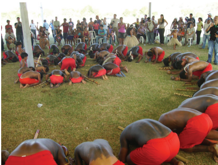
Cerimônia religiosa Krenak

proprietários (Soares, 1992), ou seja, na perspectiva do Estado, os Krenak encontravam-se desterritorializados do vale do rio Doce e reterritorializados na Fazenda Guarani. A ação do Estado em transferi-los para outras terras definia esta circunstância. Para os fazendeiros que haviam conquistado a documentação de propriedade dessas terras, os índios eram assunto encerrado. Os proprietários das terras agora eram eles, afinal havia uma garantia do Estado, os títulos emitidos pelo governo. Por outro lado, na perspectiva dos Krenak, essa lógica do Direito não era aplicável já que foram os Kraí (brancos) que os haviam retirado de suas terras. Para o índio, não era um documento que dizia quem era dono, mas sim a vivência com a terra.