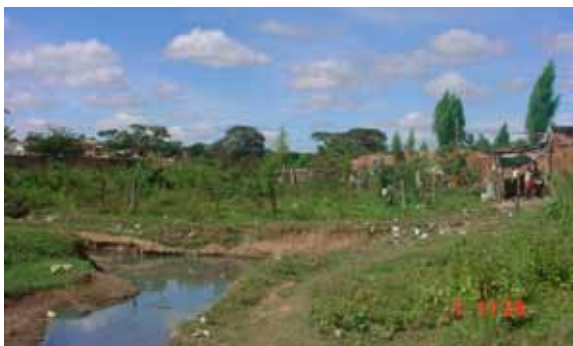
FIGURA 6 - Favela da Vila Campos, localizada na margem do rio Bicano

Como agravante para a formação de favelas na parte norte e leste de Montes Claros, está o fato de as áreas públicas presentes nesses setores da cidade estarem próximas das margens de cursos da água poluídos (Figura 6) ou em terrenos com declividade acentuada. Em alguns casos, estão dentro de voçorocas (Figura 7). Diante das características ambientais, Carvalho (2001) afirma que os terrenos que se encontram nessa situação ficam fora do mercado imobiliário legal, implicando o aumento da possibilidade de abrigar novas favelas. Nesse contexto, as áreas classificadas como de maior propensão à formação de favela concentraram-se nas regiões norte e leste da cidade, respectivamente.