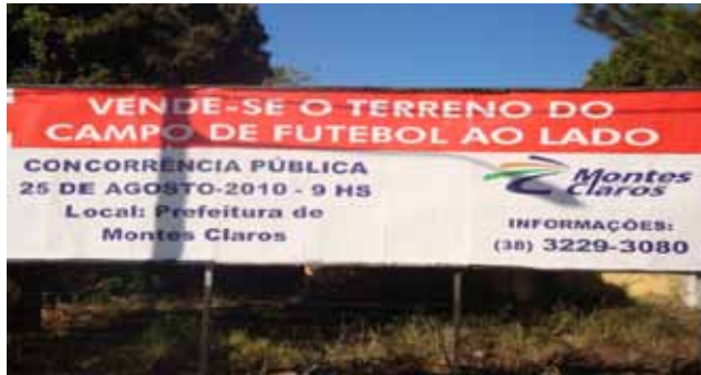
FIGURA 4 - Anúncio de leilão público para venda de terreno municipal