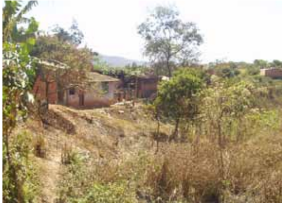
FIGURA 7 - Favela do Vilage do Lago, localizada em uma voçoroca

Desta forma, os elementos presentes em uma área pública vaga a tornam bastante vulnerável à ocupação pela população de baixa renda que está pressionada a obter uma alternativa de moradia. Neste sentido, a região norte apresentou uma concentração de áreas identificadas com risco Muito Alto e Alto para a formação de favelas, sendo classificadas nesses níveis 15 e 9 imóveis públicos, respectivamente.