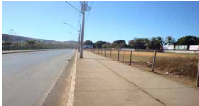
FIGURA 5 - Terreno público municipal anunciado na Figura 4