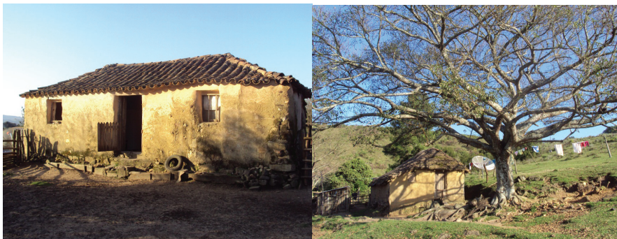
FIGURA 3 - Foto casa de pedra, a mais antiga da comunidade e casa coberta com capim Santa Fé

As casas são pequenas, com poucas peças, e a pouca luminosidade deve-se ao número reduzido e ao pequeno tamanho das portas e janelas. As casas, muitas delas centenárias, são de barro ou pedra, com cobertura de capim Santa Fé (Figura 3), ou de alvenaria e madeira. É relevante destacar que a energia elétrica é recente, e em algumas casas ela ainda não chegou. No que se refere à existência de jardins e pomares, importantes símbolos territoriais camponeses, eles não são significativos, ou praticamente inexistentes, o que se justifica pelas características culturais e pelos limitantes ambientais, comentados anteriormente.