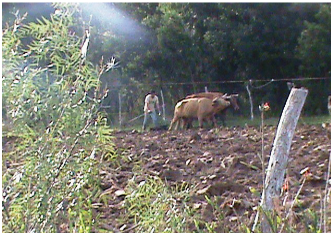
FIGURA 4 - Foto do preparo da terra com uso de força animal

memória coletiva e individual e aumento dos impactos ambientais, afetando a biodiversidade.