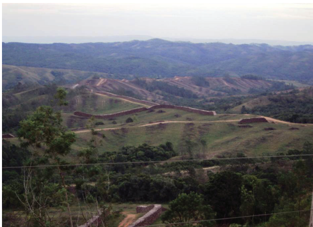
FIGURA 5 - Atividade silvícola alterando a paisagem do bioma Pampa