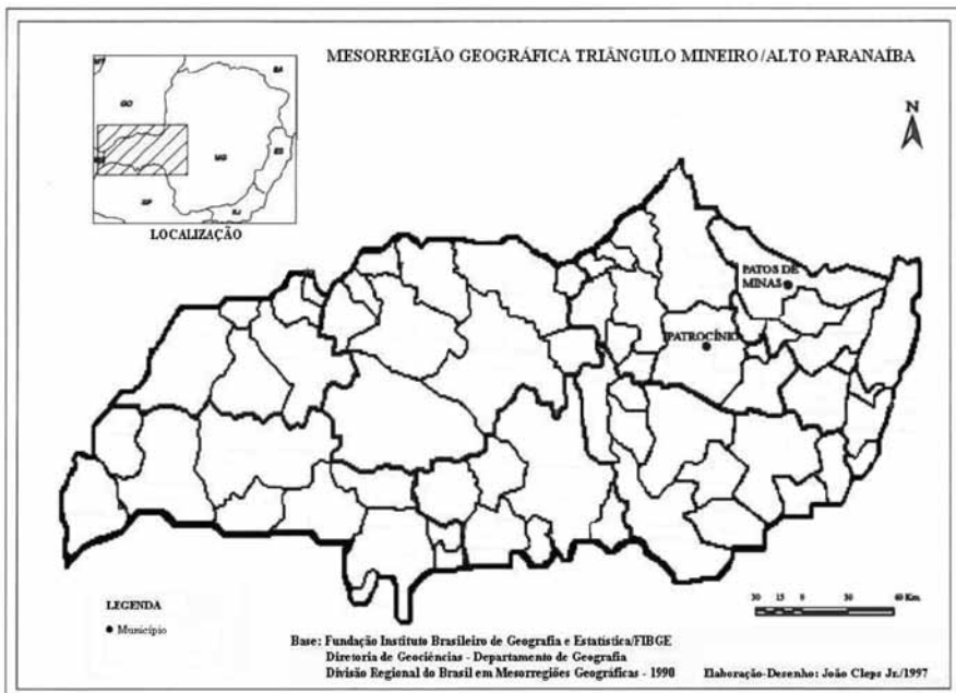
Figura 1 - Localização dos municípios de Patos de Minas e Patrocínio na mesorregião geográfica do Triângulo Mineiro/Alto Paranaíba.

A região do Alto Paranaíba, pertencente ao estado de Minas Gerais, possui uma população estimada de 635.916 habitantes, segundo dados do perfil demográfico do estado de Minas Gerais referente ao ano de 2000 (Fundação João Pinheiro, 2003, p. 38). A Figura 1 destaca os municípios de Patos de Minas e Patrocínio inseridos na mesorregião do Triângulo Mineiro/Alto Paranaíba.