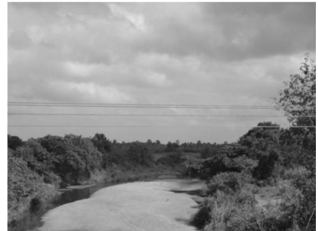
Fig. 06 - Planície Fluvial do rio Groaíras: principal afluente do rio Acaraú.