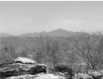
Fig 04 – Afloramentos rochosos. Maciço Residual das Serras das Matas.