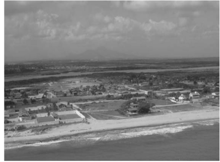
Fig. 05 - Vista aérea da Planície litorânea da Bacia do Acaraú: faixa de praia e planície flúvio-marinha