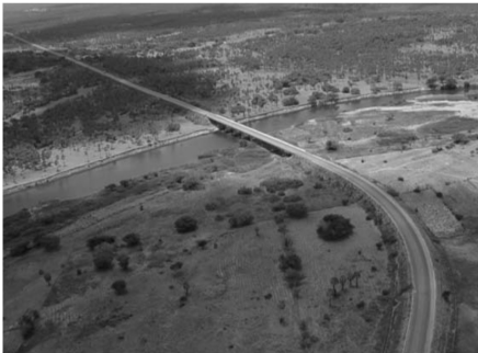
Fig. 03 - Planície fluvial do Rio Acaraú: divisa os Municípios de Cruz e Acaraú.