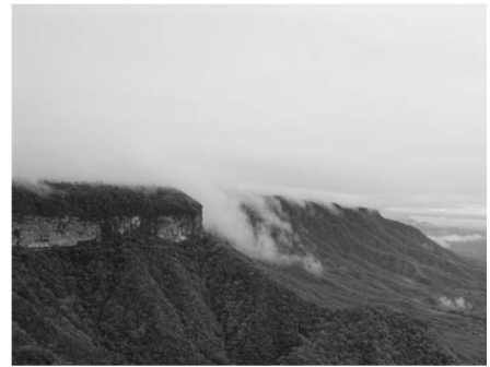
Fig. 07 - Front Central da Cuesta da Ibiapaba, exibindo a cornija arenítica sobreposta ao embasamento cristalino dissecado em cristas