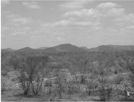
Fig. 02 - Vertente Ocidental da Serra do Machado e Sertões da Depressão Periférica do Centro-Norte do Ceará.