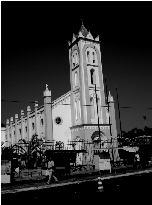
Figura 02 – Igreja Matriz do município de Pacajus, demonstrando a existência de vários ambulantes ao seu redor.

Enfim, o quadro retratado por este artigo representa a expressão de fenômenos territoriais e geográficos da dinâmica do trabalho submetida aos ditames do capital.