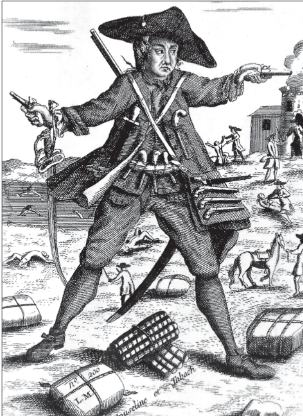
Figura 3. Mandrin e seus pacotes de tabaco (aprox. 1760).

Ele entra no imaginário popular como referência à resistência política, a uma personalidade forte ou às raízes locais. Mandrin simboliza origens, condição e fins para uma população localizada junto à fronteira alpina da França, sendo reconhecido também em outros lugares não-fronteiriços. A literatura a seu respeito hoje é produzida a partir dessas interpretações. É interessante observar a amplitude da apropriação, em que o fato de tratar-se de um contraventor não impede sua eleição como símbolo, seja em protestos contra o Estado ou em atividades culturais promovidas pelo mesmo, na escola e em museus.