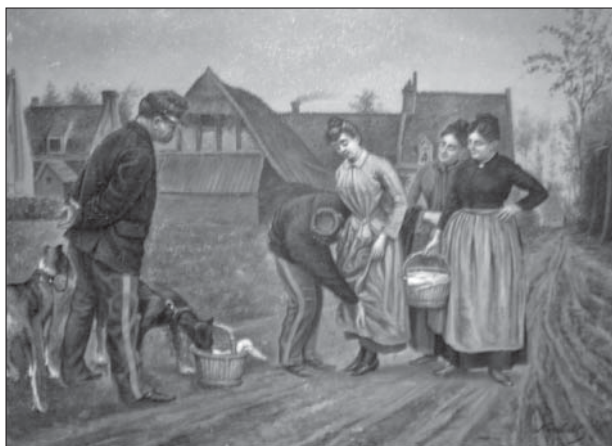
Figura 4. cópia de Rémy Kóssbuhl, Museu Nacional das Aduanas, Bordeaux, França. Foto de Daniel Francisco de Bem (01/04/2007).

França foi assassinado. Desde a manhã em que, revistando-a, ele preferiu ignorar as rendas que ela trazia enroladas nos quadris, o aduaneiro tornou-se o primeiro a apresentar-se para as emboscadas, "onde ele buscava a ocasião de ser cúmplice daquela que se instalara, de contrabando, em seu coração". Alguns meses depois, "o acaso quis que eles se casassem" no mesmo dia em que foi guilhotinado o assassino do presidente (Daeninckx, 2005, p. 17). A simultaneidade do amor e da morte, respectivamente em eventos da escala local e nacional, traça um quadro bastante complexo de fidelidades, onde o aduaneiro opta por servir à dona de