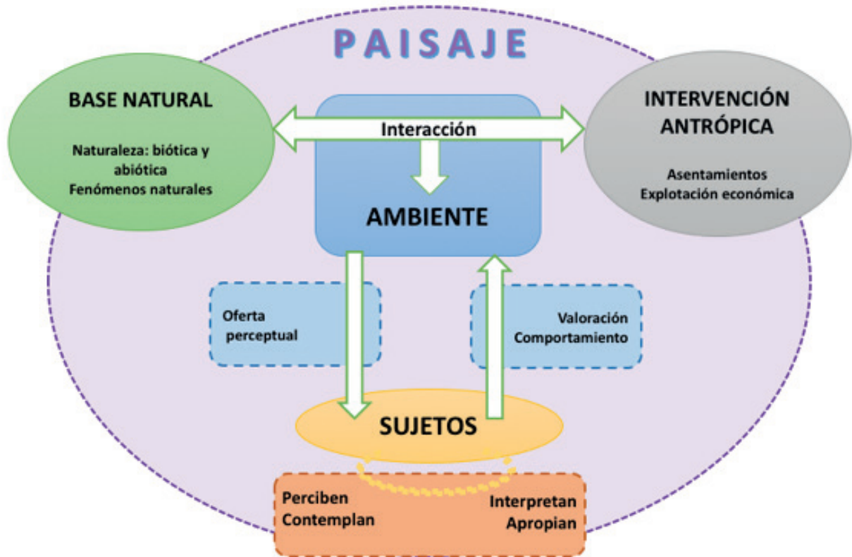
Figura 2. Construcción del paisaje