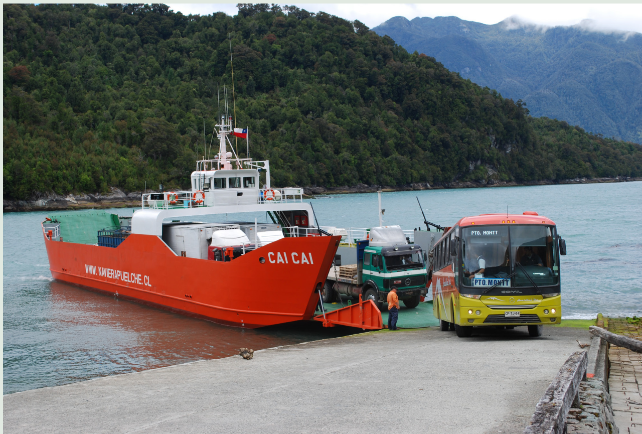
Imagen 1. Caleta Leptepu. Barcaza para transporte de carga y pasajeros