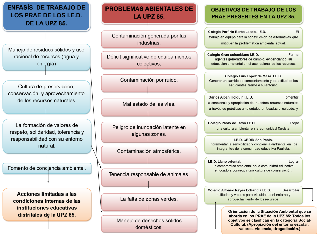
Figura 3. Relación entre los PRAE y sus aportes a la mitigación de problemas ambientales en la UPZ 85

La información se resume en la Figura No. 3. Allí se ilustran las relaciones que se establecen entre los elementos involucrados en el análisis de los PRAE y sus aportes a la mitigación de problemas ambientales en la UPZ 85. Se observa que no existe una tendencia marcada en el trabajo y atención de las problemáticas ambientales de la zona.