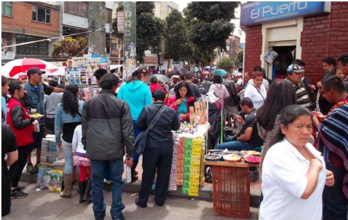
Foto No 2. El barrio Veinte de Julio

con buenas condiciones para que sus habitantes se transporten, es importante aclarar que en la avenida José Asunción Silva (Calle 27 Sur), una de las más importantes en el barrio, se ha concentrado un mercado informal y desorganizado. Este mercado informal es dirigido principalmente por sindicatos que se apropiaron del espacio público, siendo esta la principal causa de la congestión vehicular que aqueja al barrio los domingos (véase Foto No. 2).