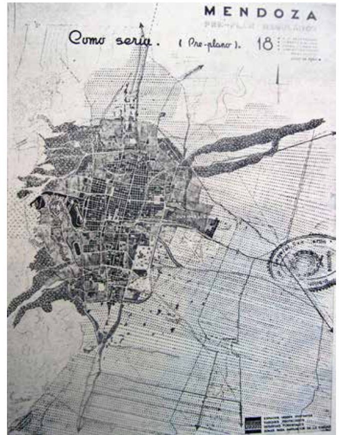
Figura No. 2. Pre-plan: diagnóstico y propuestas.

Los urbanistas hicieron observaciones sobre la ampliación del Parque San Martín, la conveniencia de detener la extensión irracional de la edificación, la necesidad de revisar el Reglamento General de Construcciones, el establecimiento de normas sobre la vivienda popular, la repavimentación de la ciudad, la necesidad de instalar centros cívicos en los barrios y la creación de un centro universitario.