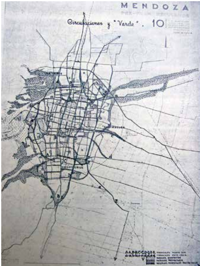
Figura No. 3. Pre-plan: propuesta de circulaciones y espacios verdes.

Como consecuencia de ello la ciudad debía ofrecer una multiplicidad de espacios abiertos y públicos que permitieran el “ocio popular”, siguiendo el principio de democratización de la ciudad.