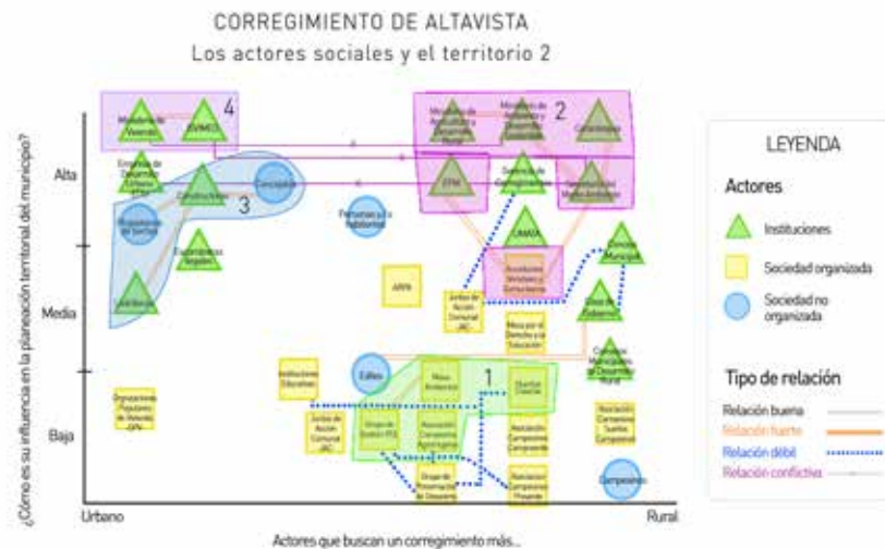
Figura No. 2. Ejemplo de un conjunto de acción ambientalista-institucional.

Es destacable que las instituciones que coinciden en proponer un modelo de corregimiento con valores rurales tengan relaciones estrechas entre sí pero casi inexistentes con el tejido asociativo. Forman así un conjunto de acción que podría