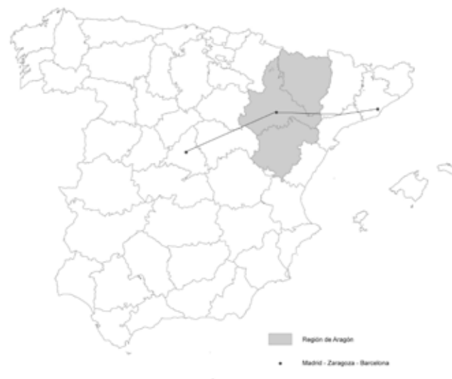
Figura No. 1. Esquema de localización de la región de Aragón.

Zaragoza es la capital de la comunidad autónoma de Aragón que cuenta con una extensión de 47.720 km 2 y 1.349.467 habitantes (Instituto Aragonés de Estadística, s.f.). Es una de las ciudades de mayor tamaño poblacional de la península Ibérica y ocupa una posición estratégica con respecto a su emplazamiento dentro de la geografía española: está localizada en el punto central del corredor del río Ebro, en el eje que comunica a Barcelona con Madrid (véase la Figura No. 1). Tras un crecimiento contenido hasta finales del siglo XX, la ciudad ha experimentado un crecimiento desmedido –tiene en la actualidad una población aproximada de 700.000 habitantes– propio de un área metropolitana caracterizada por el uso logístico e industrial del suelo en su entorno más inmediato, de forma que sus bordes urbanos se han transformado radicalmente. De manera simultánea al incremento de la población y a la formación del área metropolitana de Zaragoza, se ha dado una dinámica generalizada de decrecimiento poblacional –crecimiento negativo– en gran cantidad de pequeños núcleos de población que, junto con Zaragoza, conforman la realidad del sistema urbano de la región de Aragón (véase la Figura No. 2).