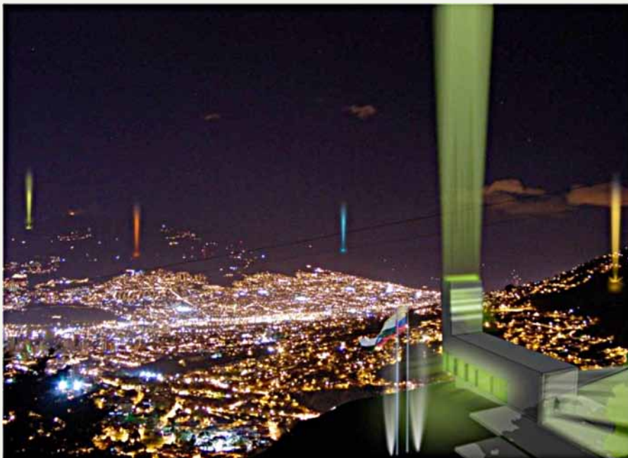
Figura 3. Visualización del proyecto de las estaciones de policía o CAI periféricos, con faros, para la vigilancia urbana.

Lo anterior puede entenderse como el ejercicio del poder “desde abajo” (Foucault, 1991), mediante la creación de subjetividades ciudadanas alrededor de las condiciones bajo las cuales el habitante de los sectores populares puede acceder a la ciudad. Su alcance, sin embargo, está limitado a los “informales” mas no a los grupos y organizaciones ilegales. Para esto existe una estrategia represiva complementaria, consistente en la implantación de establecimientos de las fuerzas policiva y militar (figura 3). La normalización de la vida barrial a través de los Metrocables tiene su complemento en la pacificación represiva.