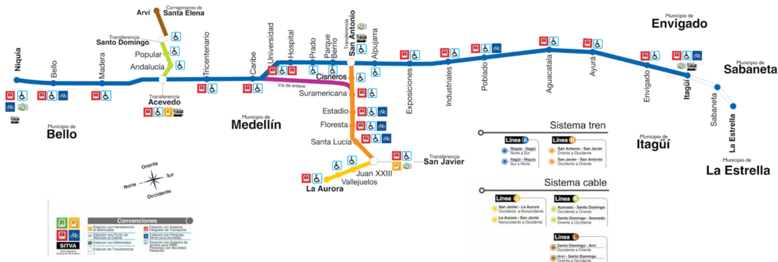
Gráfico 1. Mapa del Metro.

Los sistemas de cable aéreo utilizan una tecnología ampliamente probada en zonas montañosas y, comparados con otros sistemas de transporte masivo, son relativamente baratos, además, se posibilita su construcción en un tiempo relativamente breve, pues involucran la compra de áreas pequeñas de terreno. El costo de la línea K del Metrocable fue de 24 millones de dólares (EE.UU.) y el de la línea J, inaugurada en 2008, de 47 millones. Una desventaja notable del sistema radica en que no es técnicamente posible exceder 3.000 viajes/hora sin incurrir en altos costos adicionales 5 . No obstante, una ventaja adicional es que, en un contexto de preocupación mundial acerca de la dependencia generalizada en los combustibles fósiles y los efectos de las emisiones sobre el cambio climático, los cables aéreos utilizan energía eléctrica que, en el caso de Medellín, proviene de generación hidroeléctrica y prácticamente no genera emisiones locales (Dávila y Daste, 2011).