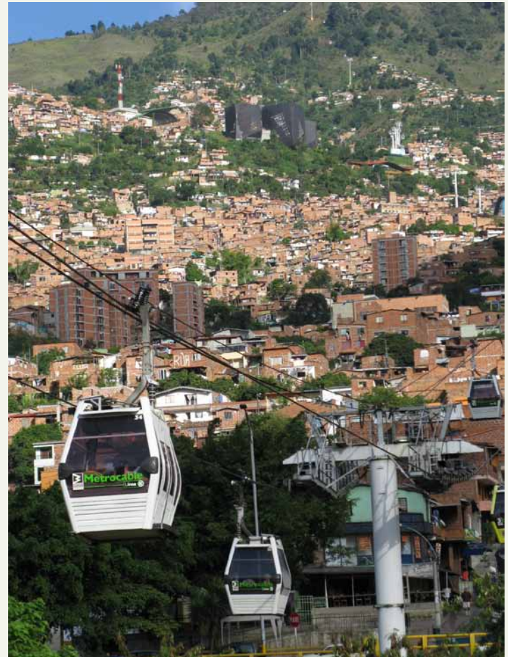
Figura 1. Barrio Santo Domingo Savio, Línea K del Metrocable y Parque-biblioteca España.

Gracias al ejemplo de Medellín, en donde se demostró que esta tecnología tiene un gran potencial en terrenos urbanos empinados y densos tejidos urbanos, se están multiplicando rápidamente los proyectos de cable aéreo en diferentes ciudades del mundo, como Caracas, Río de Janeiro, La Paz, Constantine (Argelia) y varias ciudades colombianas (Dávila, 2012).