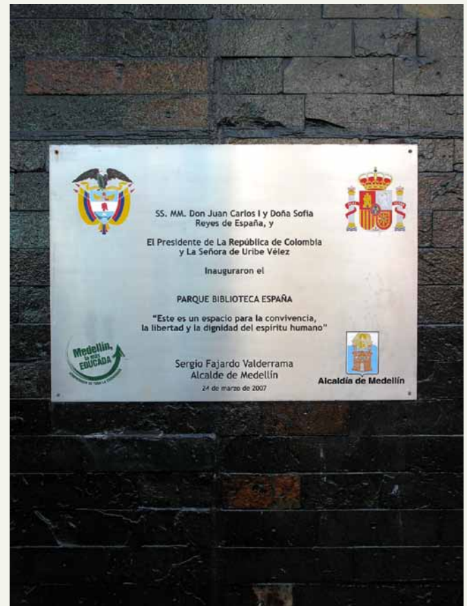
Figura 2. Placa inauguración del parque-biblioteca España.

a tomar fresco donde Abigail, la señora de la panadería. Los congresistas recorrieron estas calles y charlaron con doña Rosalba y los niños salían a montones de las casas. Los reyes de España vinieron a inaugurar la biblioteca. Llegaron en flamantes carrozas a la estación Acevedo y de allí viajaron por los aires hasta divisar los enormes monolitos. Los vecinos se asomaron a los balcones para verlos. Ellos se montaron en un autobús que los llevó hasta la puerta de la biblioteca. El Rey andaba mal de la cadera. Sólo unos pocos pudieron verlos. El protocolo decía que no podía mirárseles a los ojos. ¿Cómo hablarles a sus majestades? ¿Cómo dirigirseles? ¿Cómo vestir? ( Nuestro Metro , 2008).