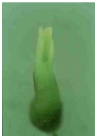
Figura 4. Embrión somático de Clematis tangutica K. en etapa de torpedo avanzado obtenido en un tratamiento con 5.0% de CO 2 a los 42 días de cultivo.