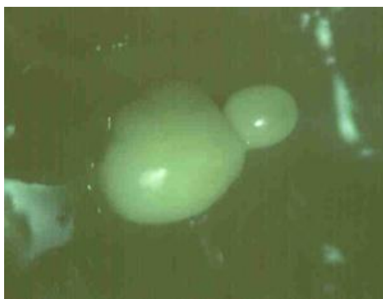
Figura 2. Embrión somático de Coffea arabica L. cv. 'Caturra rojo' con embriogénesis secundaria obtenida en el tratamiento con 5.0% de CO 2 a los 42 días de cultivo.

Los valores de supervivencia fueron altos para todos los tratamientos. Sin embargo, con 10.0% de CO 2 se encontró el mayor número de embriones malformados (Tabla 2). Los embriones tenían un color carmelita oscuro (Código hexadecimal: #29220A) y un crecimiento anormal, ya que perdieron su forma típica de la etapa globular y no se observó alargamiento bipolar (Figura 3).