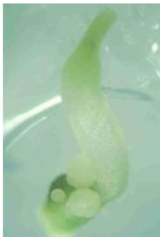
Figura 5. Embrión somático de Clematis tangutica K. con embriogénesis secundaria obtenidos en el tratamiento con 5.0% de CO 2 a los 42 días de cultivo.

Medias con letras distintas difieren significativamente para p < 0.05 según la comparación basada en la prueba de Bonferroni ( n=6 \times 25 ES). ES embriones somáticos