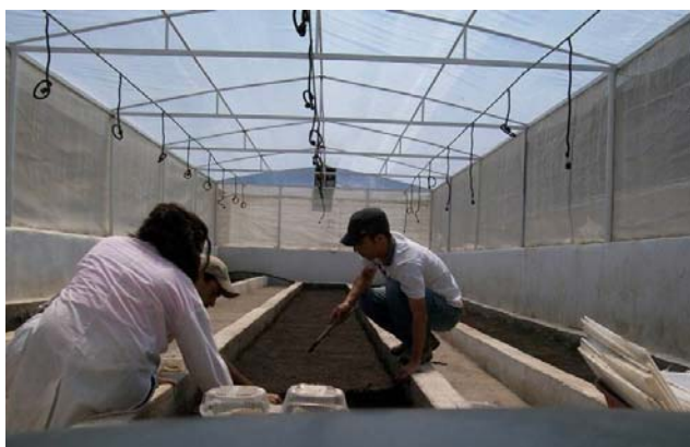
Figura 1. Vista general de las características de los canteros y la casa de cultivo en el Campo Experimental Mucuchíes, INIA-Mérida, ubicada a 3100 msnm.

En el caso de la fertilización esta se realizó con fórmula NPK (12:24:12) a voleo en la preparación del sustrato antes y al momento de la siembra. Durante el desarrollo vegetativo del cultivo, se aplicaron fertilizantes ricos en fósforo [HACHE UNO 2000, Butil 2 (3-5 trifluorometil-2- piridiloxi-fexoxi) propinato] y herbicida [Triazina, (4 amino-6 tert-butil-4,5 dihidro-3 metitio-1,2,4 triazin 5-ona], con una dosis de 1.0 l ha -1 . La segunda aplicación de fertilizantes se realizó al momento del aporque y a los 30 días, con fertilizantes foliares (Carbovit, Hit de desarrollo).