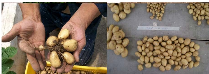
Figura 2. Minitubérculos de papa cv. 'Andinita' obtenidos en casa de cultivo a partir de microtubérculos producidos en Sistemas de Inmersión Temporal.

Medias con letras desiguales en una columna difieren según la prueba de Kruskal Wallis/Mann Whitney para p < 0.05 .