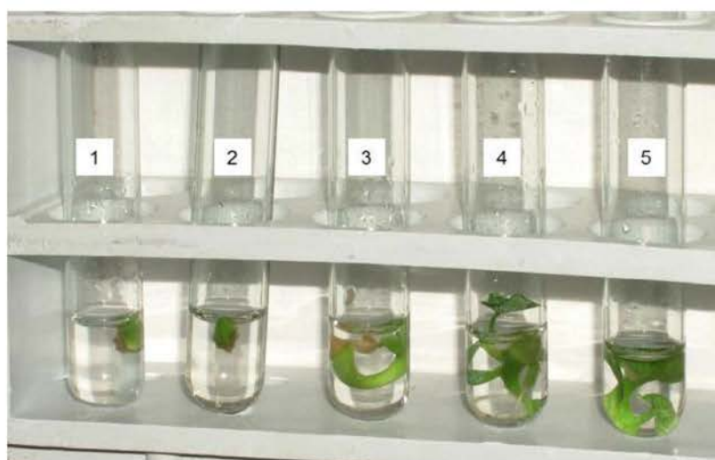
Figura 3. Características morfológicas de los explantes de malanga en cada uno de los medios de cultivo evaluados a los 29 días de cultivo. Tratamientos: 1. Sales y vitaminas MS + 0.1 mg l -1 de 6-BAP (Control), 2. Sales y vitaminas MS; 3. Sales y vitaminas MS + 0.3 mg l -1 de 6-BAP; 4. Sales y vitaminas MS + 0.5 mg l -1 de 6-BAP; 5. Sales y vitaminas MS + 1.0 mg l -1 de 6-BAP.

En cultivo in vitro de los ápices de malanga se han empleado concentraciones de 6-BAP en el medio de cultivo de establecimiento que varía desde 0.1 hasta 2.0 mg l -1 (Dotin, 2000; Rodríguez et al. , 2009). Sin embargo, autores como Huang et al. (2007) usaron para el establecimiento de cultivares de Colocasia esculenta var. esculenta