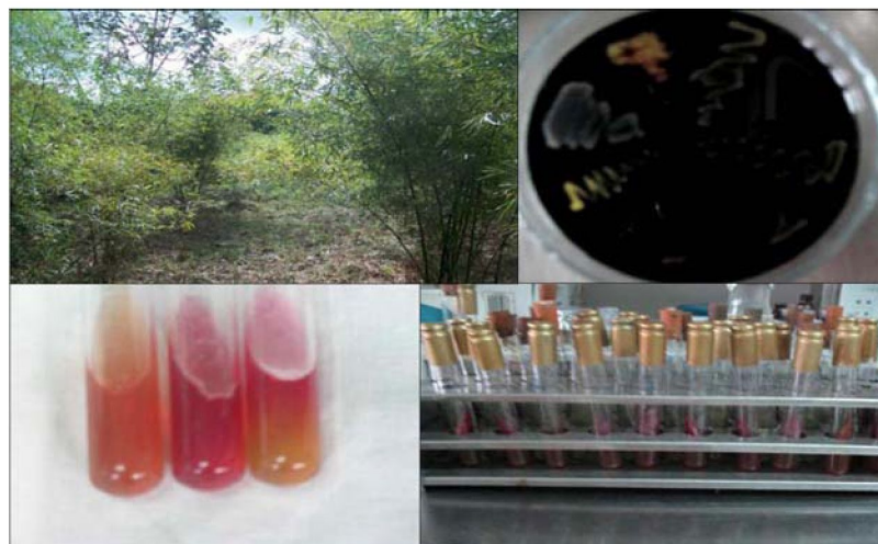
Figura 3. Bacterias aisladas de suelo de plantaciones de Bambusa vulgaris var. vulgaris .

Como resultado de este trabajo se cuenta con una colección de 80 cepas bacterianas de las cuales 23 se aislaron de medios selectivos para fijadores de nitrógeno y 10 de solubilizadores de fósforo (Figura 3).