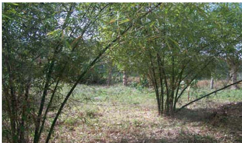
Figura 1. Plantación de B. vulgaris var. vulgaris de 4 años de cultivo, ubicada en la localidad «El Sijú» (Finca Forestal Integral) (Jibacoa, Manicaragua, Villa Clara).

Para cuantificar el número de bacterias cultivables presentes en las muestras de suelo se utilizó el método de conteo en placa. Para ello se tomó 1g de suelo (tamizado y libre de raíces) de cada tratamiento (3) (suelo tomado a 30cm del plantón de B. vulgaris , a 30cm de C. peltata y de suelo sin cultivo) y se hicieron diluciones decimales. Se realizó el conteo de ufc/g de suelo en medio de cultivo selectivo para fijadores de nitrógeno (Medio de Winogradsky, libre de nitrógeno) (Krieg y Holt, 1984) y se verificó el crecimiento de solubilizadores de fosfatos en el medio de cultivo propuesto por Mehta y Nautiyal (2001).