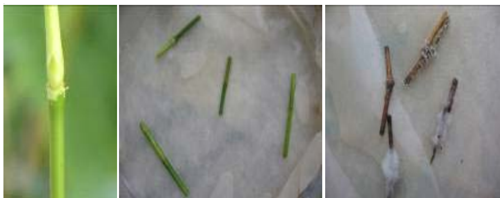
Figura 1. Explantes utilizados para el establecimiento in vitro de diferentes especies de bambú. A. Yemas seleccionadas. B. Explantes en cámara húmeda. C. Hongos filamentosos de la micobiota sobre explantes colocados en cámara húmeda, después de 14 días de incubación.

Las plantas donadoras de especies de bambúes, tuvieron una micobiota integrada por seis géneros de hongos filamentosos los cuales fueron Alternaria , Botryotrichum , Cladosporium , Curvularia , Fusarium y Nigrospora (Tabla 1). Estos hongos han sido descritos como saprofitos o patógenos de plantas y clasificados taxonómicamente dentro de la clase Hyphomycetes (Vilaró et al. , 2006).