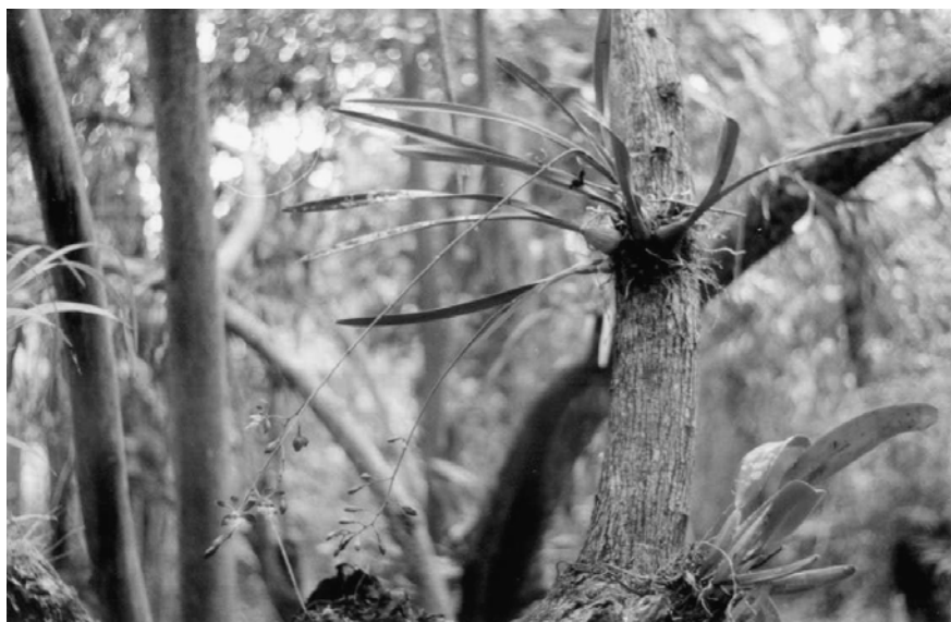
Figura1. Vista parcial del banco de germoplasma ex situ de orquídeas silvestres

Los frascos se incubaron a la oscuridad durante siete días y luego a 16 horas luz de fotoperíodo a intensidad de 27 \mu\text{mol.m}^{-2}.\text{s}^{-1} y 25 \pm 2^\circ\text{C} . Se observó semanalmente la presencia de fenolización y se cuantificó el número de semillas germinadas.