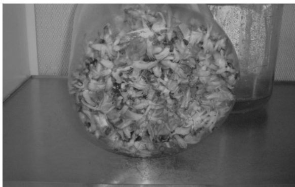
Figura 3. Brotes in vitro del cv. híbrido 'FHIA-21' (AAB) cultivados con 2.0 de 6-BAP, 0.65 mg.l -1 de AIA y 1.0 mg.l -1 de paclobutrazol a los 21 días de cultivo en Sistema de Inmersión Temporal.