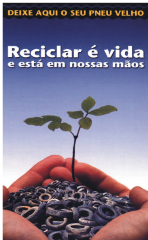
Figura 2. Cartel del Proyecto ecológico "Reciclar es vida", de Brasil.

En un estudio sobre el aporte de la investigación social en las actividades de control y prevención del dengue en Fiji, en el Pacífico Sur [44], se demostró que "...se deben realizar estudios sociales con regularidad a lo largo de un programa basado en la comunidad, para hacer modificaciones sobre la marcha y movilizar a las personas. El tipo tradicional de investigación -consistente en investigaciones iniciales de línea base, que son repetidas al final del proyecto o programa, sin otras investigaciones durante el desarrollo del proyecto- no permite optimizar los métodos de movilización comunitaria durante el desarrollo del proyecto. El uso frecuente de investigación participativa transformó también el proyecto y permitió que se crearan nuevas redes durante la planeación de la investigación..." [44]. De ahí la importancia de desarrollar puntos de encuentro entre el conocimiento epidemiológico y el conocimiento de las ciencias sociales y la comunicación.