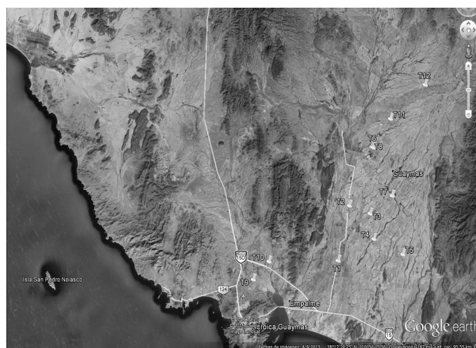
Figura 1. Ubicación de trampas de capturas de mosca blanca en el Valle del Guaymas-Empalme, Son.