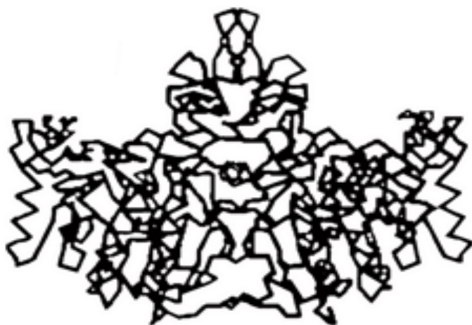
Figura 1. Estructura de la fosfatasa alcalina de camarón Figure 1. Shrimp alkaline phosphatase structure. Fuente: Hough et al. , 2002.