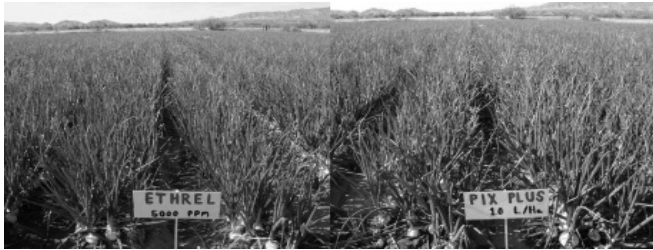
Figura 2. Mejores tratamientos (Ethrel y Pix Plus) para reducir la emisión de tallo floral en cebolla.

Figure 2. Best treatments (Ethrel y Pix Plus) to reduce bolting in onion.