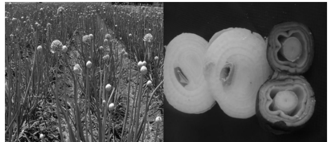
Figura 1. Daño de la emisión de tallo floral en cebolla.

La emisión de tallo floral es un problema que afecta la producción y calidad de la cebolla en México (Figura 1), estimándose el daño hasta un 30% el cual varía de acuerdo a las condiciones climáticas y a la fecha de siembra (Macías y Grijalva, 2006). Por tal motivo, se planteó el presente trabajo de investigación cuyo objetivo fue evaluar el efecto de algunos reguladores de crecimiento sobre la emisión de tallo floral.