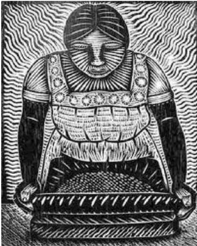
Figura 3. Molienda del grano de maíz.

presentar dermatitis, diarrea y demencia (enfermedad de las tres "D") (Badui, 2006). Cobró la vida de cientos de miles de pobladores rurales de Europa, Estados Unidos y muchos otros países. A pesar de la gran oposición de la ciencia médica a aceptar que el origen de la pelagra era dietético, la población europea asoció al maíz como no apto para el consumo humano y lo usaron para alimentar a sus cerdos y ganado, como es aún el caso, cuando para nosotros es regalo de los dioses que nos ha permitido sobrevivir más de 5000 años y crear una gastronomía asombrosa y nutritiva (Dultzin, 2011).