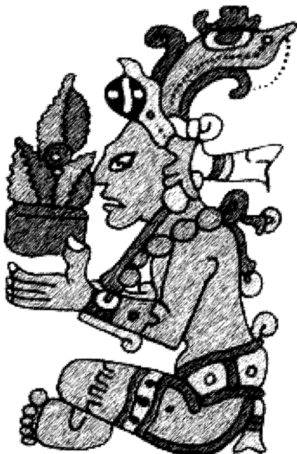
Figura 4. Yum Káax . Yucatán: Identidad y cultura maya. http://mayas.uady.mx

La cabeza del dios puede sustituir a las mazorcas y sus largos cabellos se equiparan con los del elote. En las inscripciones se le utilizó para señalar el número 8 ( waxak ), por lo que puede considerarse patrono de esta cifra. Igualmente debió ser el dios tutelar del día K'an , cuarto del calendario ritual, que representa un grano de maíz. En los códices este glifo aparece en el tocado de la deidad, y de él germina la planta (figura 4). A pesar de que se cuenta con numerosas representaciones, su nombre no es del todo conocido. El jeroglífico que acompaña a sus imágenes en los códices se ha leído como nal (maíz) (Museo Nacional de Culturas Populares, 1987).