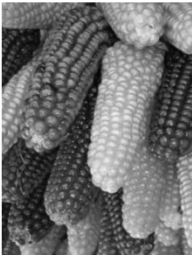
Figura 1. Maíz amarillo y rojo ( http://chucpastor.blogspot.com )

Figure 1. Yellow and red corn ( http://chucpastor.blogspot.com )