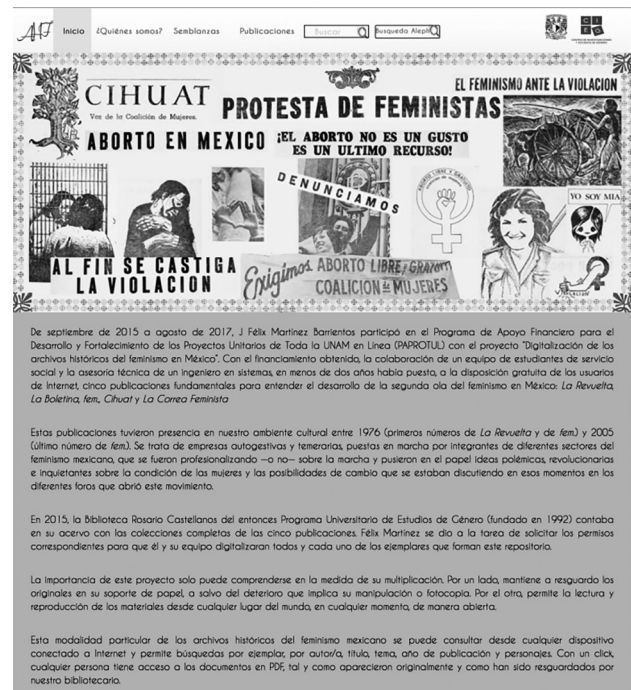
Imagen 1. Página web de Archivos Históricos del Feminismo

rebasado por la ingente cantidad de usuarias y usuarios (había quien consultaba los documentos de pie). 46 Junto con el cambio en la modalidad del servicio de consulta, la remodelación favoreció las funciones del personal de la Biblioteca y la experiencia del tiempo de permanencia de usuarias y usuarios; 47 durante este periodo se presentó formalmente un nuevo reglamento en la Comisión de Información en Género de los Acervos de Revistas y Repositorio de Información (SIGARI), del PUEG, se incorporó al proyecto de Institucionalización y transversalización de la perspectiva de género en la UNAM. 48