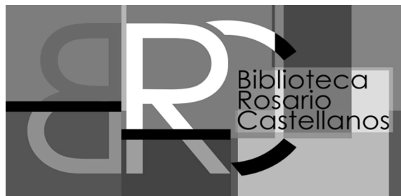
Imagen 3. Nueva identidad de la Biblioteca “Rosario Castellanos”

Con apoyo del Departamento de Tecnologías de la Información y Comunicación del CIEG se implementó el Sistema Integral para la Gestión de Adquisiciones de la Biblioteca “Rosario Castellanos”. Este nuevo sistema permite administrar las propuestas bibliográficas, así como darle seguimiento a la selección de la Comisión de Biblioteca y controlar las solicitudes de compra y donaciones”. 56