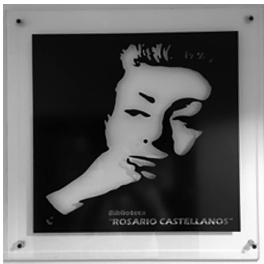
Imagen 2. Antigua identidad de la Biblioteca “Rosario Castellanos”

Un servicio adicional es la renovación de préstamo a través de la página web de la BRC. El equipo de la Biblioteca elabora bimensualmente un boletín que desde octubre de 2019 lleva por título Materia memorable. Boletín de nuevas adquisiciones y servicios bibliotecarios . En cada número se presenta a un personaje –generalmente alguna persona del ámbito académico y reconocida en el campo de los Estudios de Género– con su respectiva bibliohemerografía, disponible tanto en la Biblioteca como en texto completo en acceso abierto. Junto con el nombre del boletín se presentó la nueva imagen identitaria de la Biblioteca (imágenes 2 y 3).