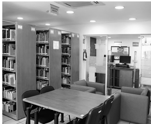
Fotografía 3. La Biblioteca “Rosario Castellanos”.

De 2015 a 2017, con la aprobación del Programa de Apoyo Financiero para el Desarrollo y Fortalecimiento de los Proyectos Unitarios de Toda la UNAM en Línea (PRAPOTUL), se llevó a cabo el proyecto denominado Archivos Históricos del Feminismo, 51 que consistió en la digitalización de cinco revistas feministas que surgieron durante la segunda ola del feminismo en México. Dado que la Biblioteca “Rosario Castellanos” contaba con todos los números de La Revuelta , La Boletina , Fem , Cihuat y La Correa Feminista , J. Félix Martínez se dio a la tarea de solicitar los permisos necesarios para su digitalización. El objetivo de este trabajo fue contribuir con la preservación de dichas publicaciones y brindar la disponibilidad de acceso a documentos de valor histórico como lo son estas revistas.