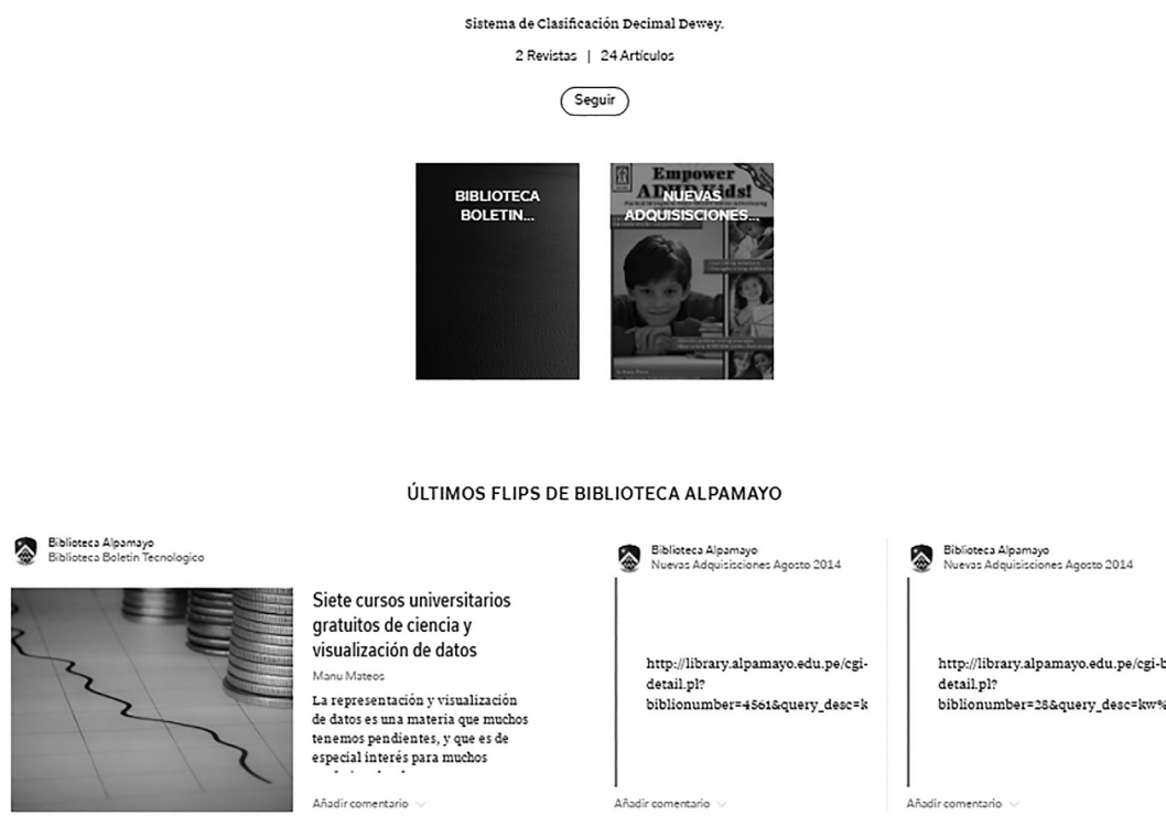
Imagen 3. Captura de pantalla del boletín de la Biblioteca del Colegio Alpamayo (Perú) desarrollado con la herramienta Flipboard