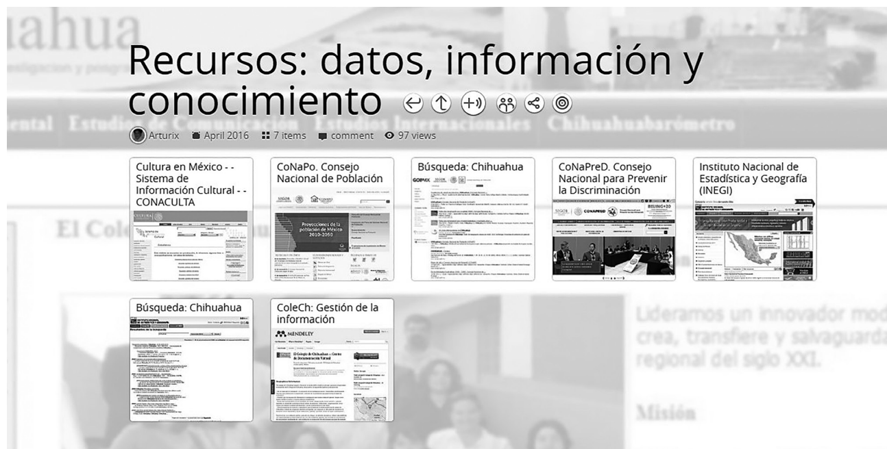
Imagen 2. Captura de pantalla de la colección Recursos: datos, información y conocimiento de El Colegio de Chihuahua (México) creada con la herramienta Pearltrees

Fuente: http://www.pearltrees.com/arturix/informacion-conocimiento/id9522378#l046 (Consultada el 19 de octubre de 2016).