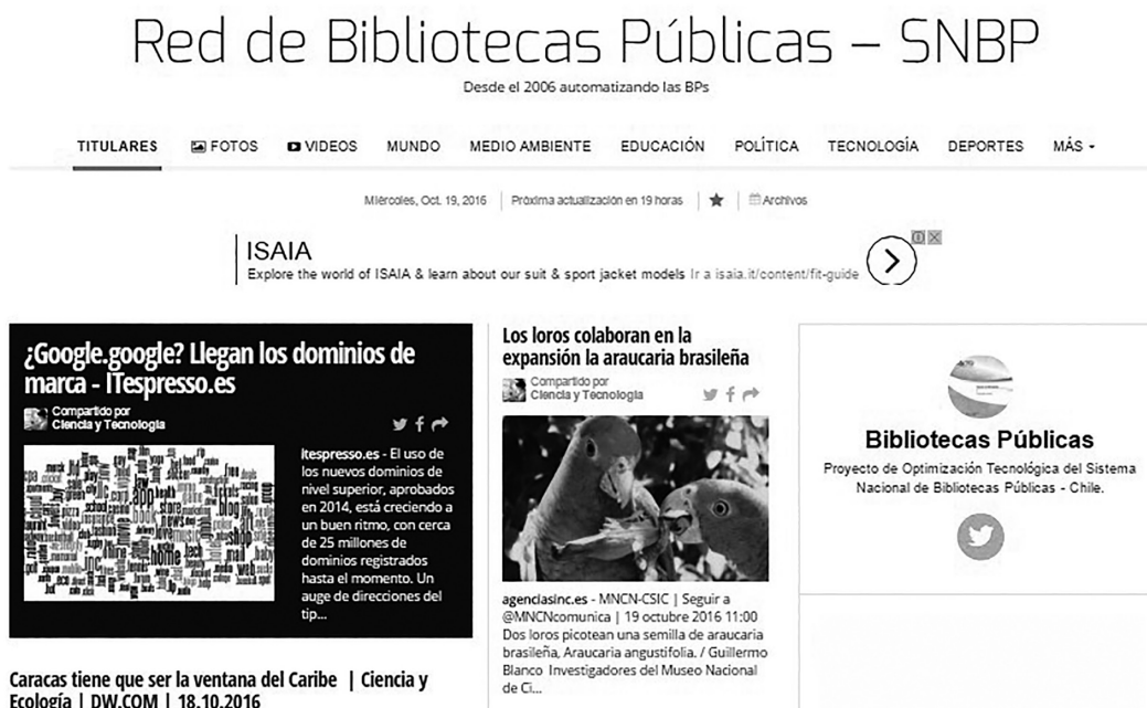
Imagen 1. Captura de pantalla del periódico del Sistema Nacional de Bibliotecas Públicas de Chile desarrollado con la herramienta Paper.li