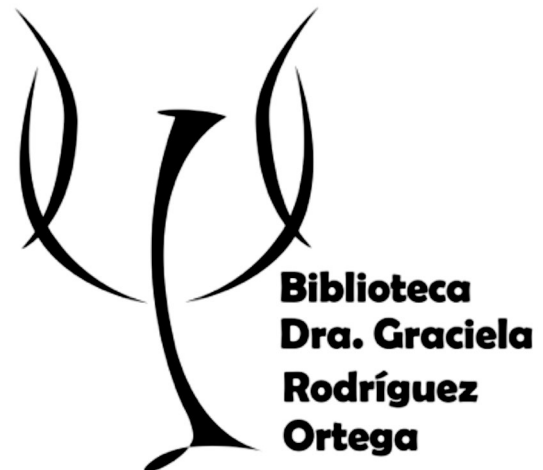
Logotipo de la Biblioteca.

el 20 de mayo de 2013, en su 5 a sesión, la Comisión de Biblioteca aprobó el logotipo de la Biblioteca.