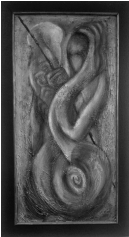
Guerrero. Piedad Aladro. 2009. Técnica mixta. Obra recibida en donación de la autora en 2013.

La dinámica que alimenta el trabajo de la Biblioteca “Dra. Graciela Rodríguez Ortega” tiene su fortaleza principal en la interacción con su comunidad y, por lo mismo, el desarrollo y diseño de la colección, el establecimiento de canales de comunicación y servicio a distancia en tiempo real, la mejora constante del ambiente de estudio y trabajo, así como la uniformidad y normalización de los recursos documentales propios, son actividades permanentes que tienen por objeto el establecer un escenario de información acorde y suficiente para la comunidad, de forma tal que la Biblioteca es un espacio propicio para la apropiación y creación de conocimientos.