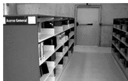
Salida de emergencia

Existen tres salidas de emergencia distribuidas en la biblioteca, una salida por cada nivel, lo que permite ofrecer una correcta evacuación de los usuarios en caso de ser necesario.