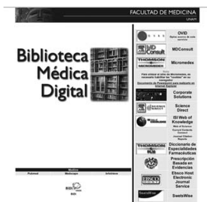
Página de la Biblioteca Médica Digital www.facmed.unam.mx

En 2005 se iniciaron los trabajos con la Dirección General de Bibliotecas y la Dirección General de Servicios de Cómputo Académico (DGSCA) para el acceso a las fuentes de información electrónica (FIE) para académicos y alumnos de la Facultad de Medicina desde cualquier compu-