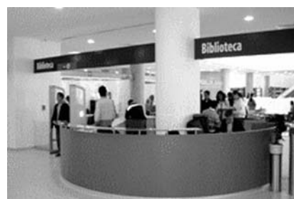
Entrada / Salida de la Biblioteca

Se actualizó la infraestructura de cómputo con la adquisición de 40 computadoras. El edificio cuenta también con una fuente de energía alterna (UPS y planta de emergencia) para garantizar el suministro eléctrico.