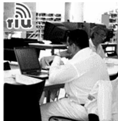
Conexión a red de computadoras

Los usuarios pueden conectar su computadora portátil a internet y por ende a la RedUNAM, en cualquier lugar de estudio de la biblioteca, a través de los 130 nodos de red