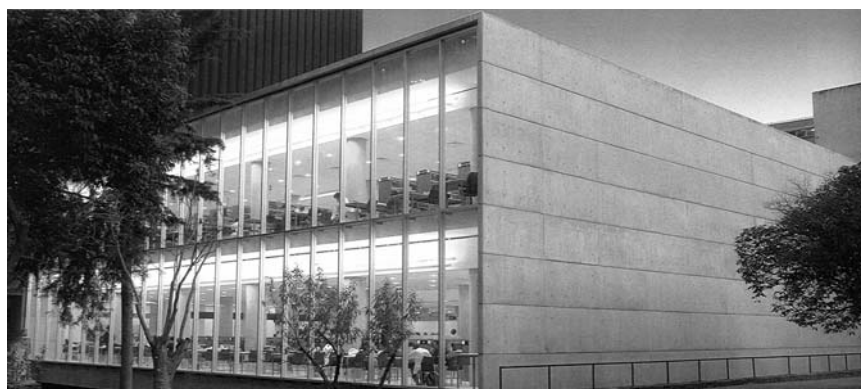
Vista principal de la Nueva Biblioteca