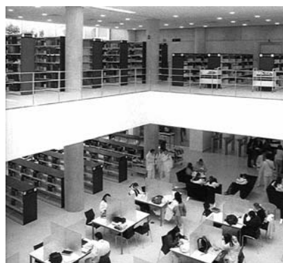
Sala de Lectura Individual