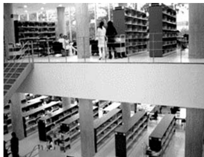
Planta Baja y Primer Nivel de la Nueva Biblioteca

A través del personal académico de la biblioteca se proporcionan cursos y asesorías a alumnos y académicos de la FM y de otras instituciones, principalmente en las áreas de desarrollo de habilidades informativas, uso de fuentes de información electrónica, biblioteca digital y temas afines.