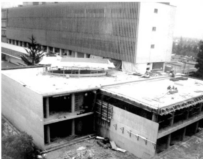
Construcción de la Nueva Biblioteca de la Facultad de Medicina vista desde la Facultad de Química