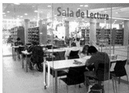
Sala de Lectura en Silencio