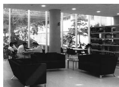
Sala de Lectura Informal