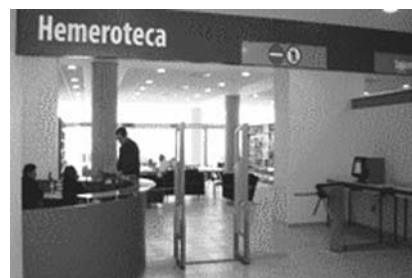
Entrada / Salida de la Hemeroteca