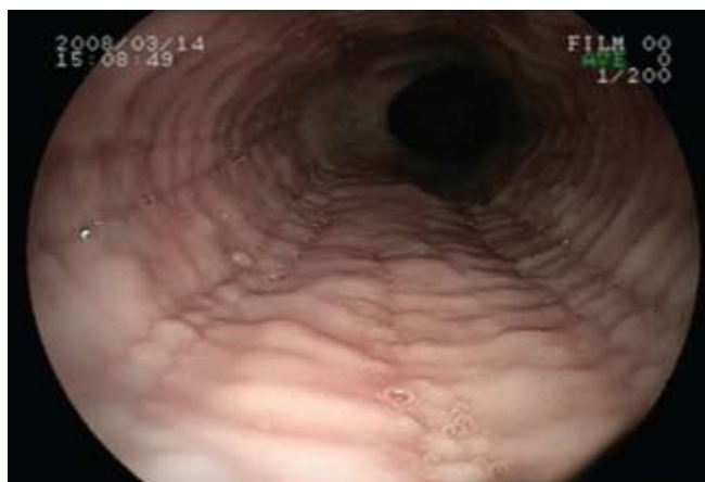
Fig. 1: Traquealización esofágica