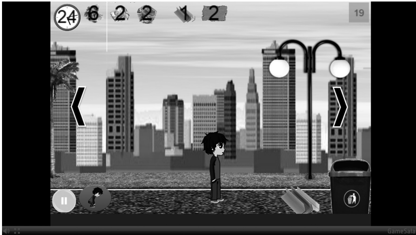
Fig. 3. Nivel 2 del videojuego "Blue Sky"

■ Jéssica Pérez Rivera, Joel Pérez Suárez