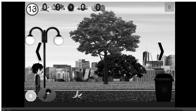
Fig. 2. Nivel 1 del videojuego "Blue Sky"