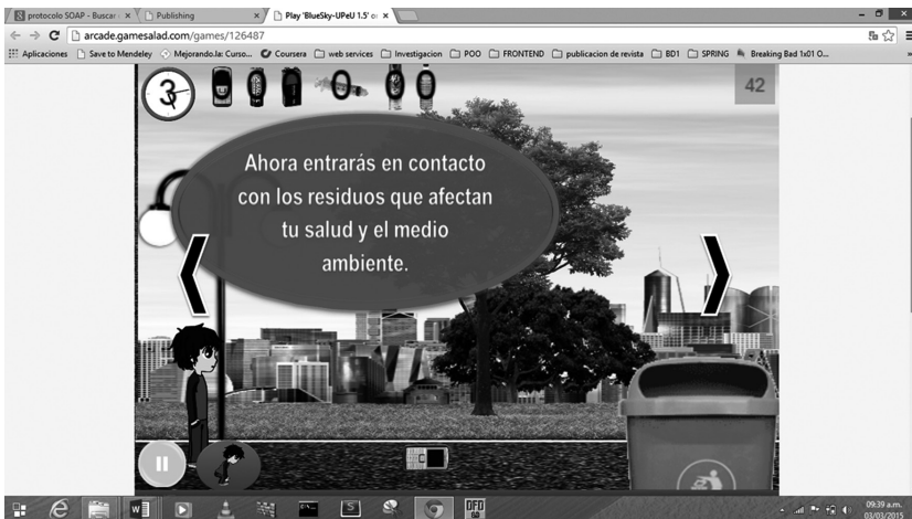
Fig.4. Nivel 6 del videojuego "Blue Sky"