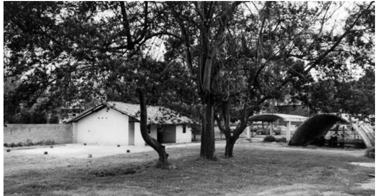
Figura 20: Prototipo de vivienda campesina para altiplano, Bogotá.

Otras casas en Colombia se fabricaron en San Jerónimo (1956), Caicedonia, Chambimbal (1957). En el continente americano, casas en Trinidad y Tobago, Bolivia, Argentina, Chile, Estados Unidos, Guatemala, Costa Rica, México, Panamá,