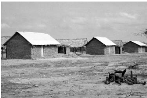
Figura 19: Puerto Inirída, Guainía.