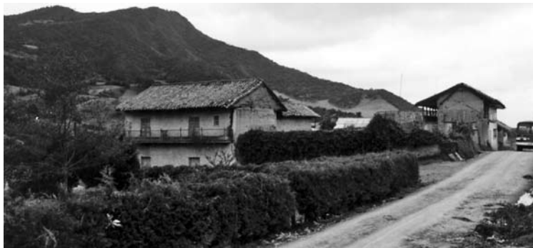
Figuras 7 y 8: Casa Familia Rodríguez, Tausa.