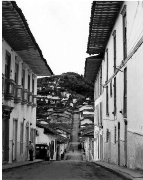
Figura 14: Salamina, Caldas.

Los sistemas para construir la cerca son vara parada , rejilla o trabilla y embutido . Es frecuente que se encuentre un mayor uso de alguno de ellos en ciertas zonas, asociado a una mayor complejidad y desarrollo del sistema de acuerdo con la subregión.