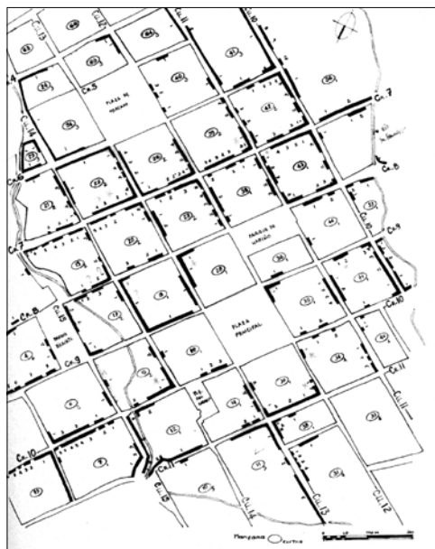
Figura página anterior: Hostal Santa Bárbara, Barichara, Colombia, 2006.