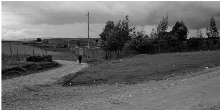
Figura 6: Chircal El Retamo en primer plano.