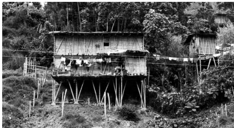
Figura 15: Casa entre Neira y Aranzazu.

Al analizar estos sistemas se observa que están compuestos por una estructura principal y un sistema complementario, en materiales como maderas y cañas, que responden adecuadamente a las solicitaciones estructurales necesarias, es decir, son resistentes y flexibles. Además, en su conjunto, la estructura es capaz de mantener su forma o, en otras palabras, es suficientemente rígida e independiente de dos grandes partes, el sistema estructural propiamente dicho de la cerca y de la estructura de cubierta o casa en canilla .