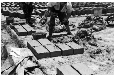
Figura 10: Alisado de adobe.