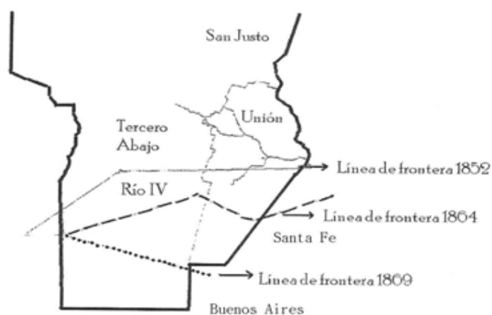
Figura 1- Mapa de la provincia de Córdoba y de la frontera sur

El análisis se concentró en dos variables el número de operaciones y la superficie transferida por medio de ellas. Las magnitudes que alcanzaron una y otra eran fundamentales, en primer lugar, para establecer qué lugar ocuparon las compraventas y, en segundo, para determinar si a lo largo del período abarcado se consolidaron como la principal forma de acceso a la propiedad.