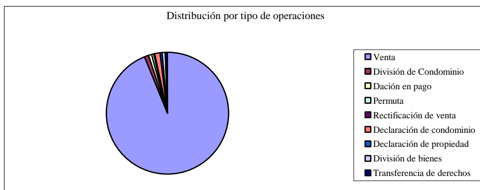
Gráfico 1- Operaciones por tipo