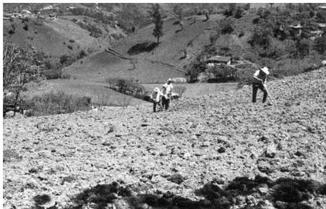
Figura 5. Para el cultivo se utiliza el sistema de “mano vuelta”. Fotografía de Hugo Rodríguez González, 2013

Para comprender la importancia de los sistemas de “ayuda” que funcionan en los ámbitos familiar e interfamiliar señalaré el sistema conocido como “mano vuelta” (ver la figura 5), gracias al cual es posible realizar de manera colectiva todas las actividades vinculadas al ciclo agrícola de una manera rápida en los tiempos requeridos. Este sistema permite que un grupo familiar extenso o un grupo generacional se reúnan, por ejemplo, para sembrar un terreno de cultivo. Los dueños del terreno “piden el favor” a alguien para que funja como “padrino de la semilla”; esta persona tiene la obligación de acudir a su vez a “solicitar el favor” a varios acompañantes para que lo “ayuden” con su compromiso. El día acordado los dueños del terreno, todos los acompañantes y el “padrino de la semilla”, quien será el “capitán de la siembra”, realizan un ritual para los “aires” del terreno e inician la siembra de la milpa. Al final de la jornada los dueños del terreno otorgan alimentos y bebidas a todos los participantes. Por formar parte de este sistema, cada integrante adquiere a su vez el compromiso de ir a sembrar en el terreno de cada uno de los participantes.