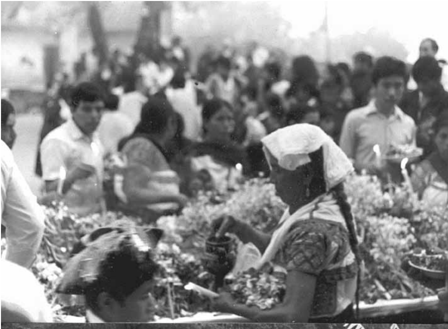
Figura 4. Rituales propiciatorios para la protección de las cosechas. Fotografía de Hugo Rodríguez González, 2013

La obtención de las cosechas se encuentra determinada tanto por el esfuerzo humano como por la benevolencia de las fuerzas de la naturaleza, y el ciclo agrícola se encuentra enmarcado por rituales que buscan propiciar a las deidades, llamadas genéricamente “aires” o yeyekatlames, para proteger las siembras y obtener de la naturaleza la medida justa de lluvia, viento y sol que permita cosechar los productos de la tierra (ver la figura 4).