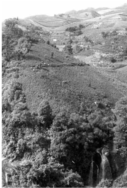
Figura 2. Variaciones ecológicas en la zona descrita. Fotografía de Hugo Rodríguez González, 2013

con diversas especies, éstas son escasas, ya que la explotación de los bosques ha sido muy alta, lo que ha provocado un cambio drástico en los procesos biológicos de síntesis del humus de estos suelos. Aquí la humedad es alta y se presenta neblina durante todo el año; en la zona de altura media se encuentran especies de bosque tropical perennifolio y algunos elementos de selva alta perennifolia en la ribera del río San Marcos perteneciente a Tenexitla –la población más alejada, al oriente, de la cabecera municipal–. En esta área es posible encontrar algunas especies de caoba y otras maderas preciosas (Pérez Ruiz, 2006).