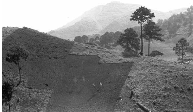
Figura 3. Áreas de cultivo en la zona alta. Fotografía de Hugo Rodríguez González, 2013

La principal actividad económica de los pobladores de la zona es la agricultura de temporal (ver la figura 3), el cultivo de la milpa 2 , el cual se realiza con fines de subsistencia, al igual que la recolecta, y en menor medida, la caza y la pesca. También realizan cultivos para el comercio, que corresponden, según la clasificación realizada por Alfaro Martínez y Masferrer (2010) para la Sierra Norte de Puebla, al agroecosistema de café de baja tecnología, en donde los cultivos del café, el chile, la jícama y el cacahuate son realizados especialmente para la venta, y donde el cultivo, debido a lo escarpado del terreno, se realiza utilizando como herramientas fundamentales la coa y el machete.