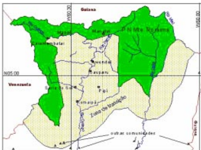
Figura F2: Área do PARNA do Monte Roraima, Zona de Transição e aldeias indígenas