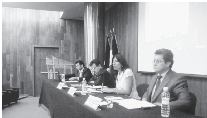
Archivo 1. MASC. Mesa

Por ello, hace falta abrazar una política sistémica que instaure y aliente procesos pedagógicos que provoquen el razonamiento, la construcción de conocimiento y opinión crítica, más allá de una Reforma Educativa 2013 o juegos políticos. Este llamado juego de tronos en la política al interior de la administración pública federal y universitaria, en muchos casos