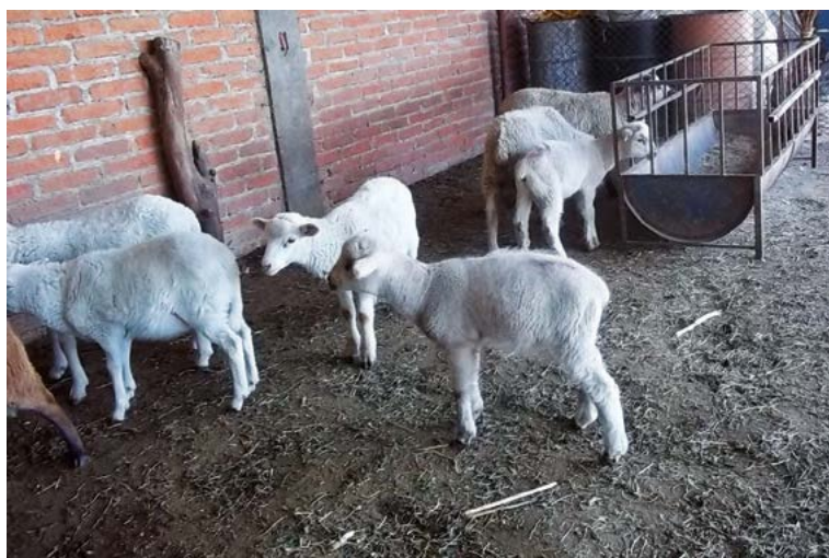
Figura 6. Corderos hijos de ovejas complementadas con SeMet y sin SeMet.

a Desviación estándar; b Ovejas testigo; c Ovejas con adición de selenometionina.