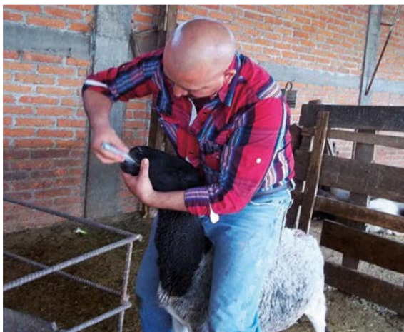
Figura 1. Complementación con SeMet a ovejas gestantes vía oral

donde, ovejas con nutrición restringida tienen fetos de masa reducida en comparación con ovejas que tienen nutrición balanceada (Lekartz et al. , 2010), el mal estado de salud y baja condición corporal son determinantes para el desarrollo del feto, lo que suele resultar en retraso productivo futuro, esta disminución del rendimiento productivo puede ocurrir aun cuando el peso al nacimiento no se vea afectado (Meyer et al. , 2011). La provisión de Selenio a la madre durante la gestación y lactación es eficaz para cubrir los requerimientos en el recién nacido (Figura 2) debido a que el Selenio cruza eficientemente la barrera placentaria, además de concentrarse en el calostro y la leche (Hall et al. , 2014; Zarczynska et al. , 2013), la forma orgánica de Selenio es más eficaz que las formas inorgánicas en su capacidad para transferir Selenio a lactantes humanos y de otras especies mediante el amamantamiento, reduciendo el riesgo de deficiencia en la descendencia (Rayman et al. , 2008). Con base en lo anterior, se realizó un estudio para identificar la influencia de Selenio en el peso al nacimiento y ganancia de peso de corderos nacidos de madres com-