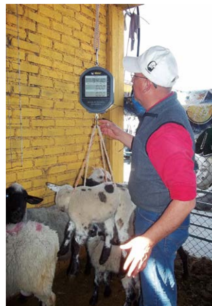
Figura 3. Pesaje de corderos hijos de ovejas con SeMet y sin SeMet.

La concentración de Selenio en suero sanguíneo de ovejas (Cuadro 1) entre los grupos en estudio evidenciaron aumento en ovejas tratadas con SeMet el día 25 ( P < 0.05 ), y coincide con lo mencionado por Carlson et al., (2009) y Stewart et al., (2012). La concentración sérica de Selenio en corderos a los seis días de edad no indicó diferencia, mientras que a los 25 días de vida se observó diferencia predominando la concentración media de Selenio en