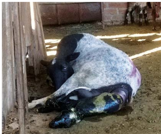
Figura 2. Parto de oveja tratada con SeMet.