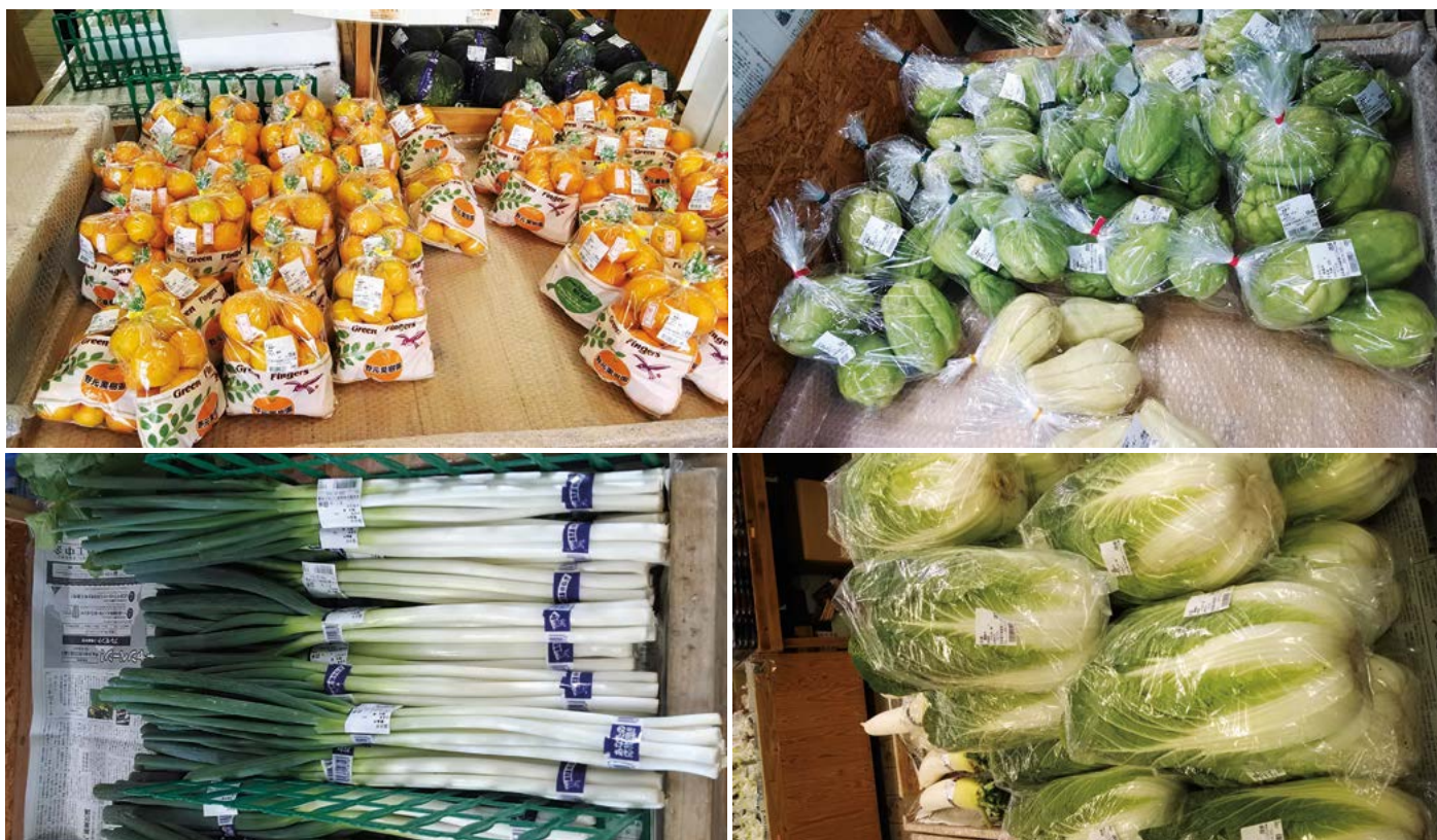
Figura 4. Hortalizas "orgánicas" en condiciones de mercadeo justo: del productor al consumidor.