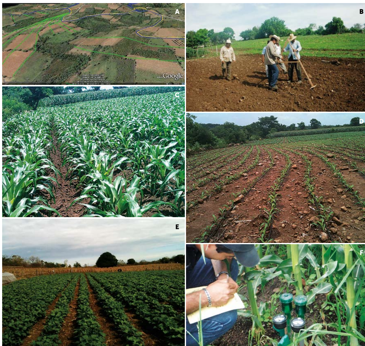
Figura 3. A: Trazo general de irrigación. B-D: Trazo de curvas a nivel con triángulo "A" para siembra de maíz. E: Siembra de frijol. F: Registro de datos en tensiómetros.

mostrarán un cambio positivo como el que se espera; y se estará en condiciones de tomar ventaja de los efectos de las lluvias torrenciales que llenen rápidamente las pequeñas represas, con lo que se podrá mejorar la calidad de vida de los pobladores del ámbito rural.